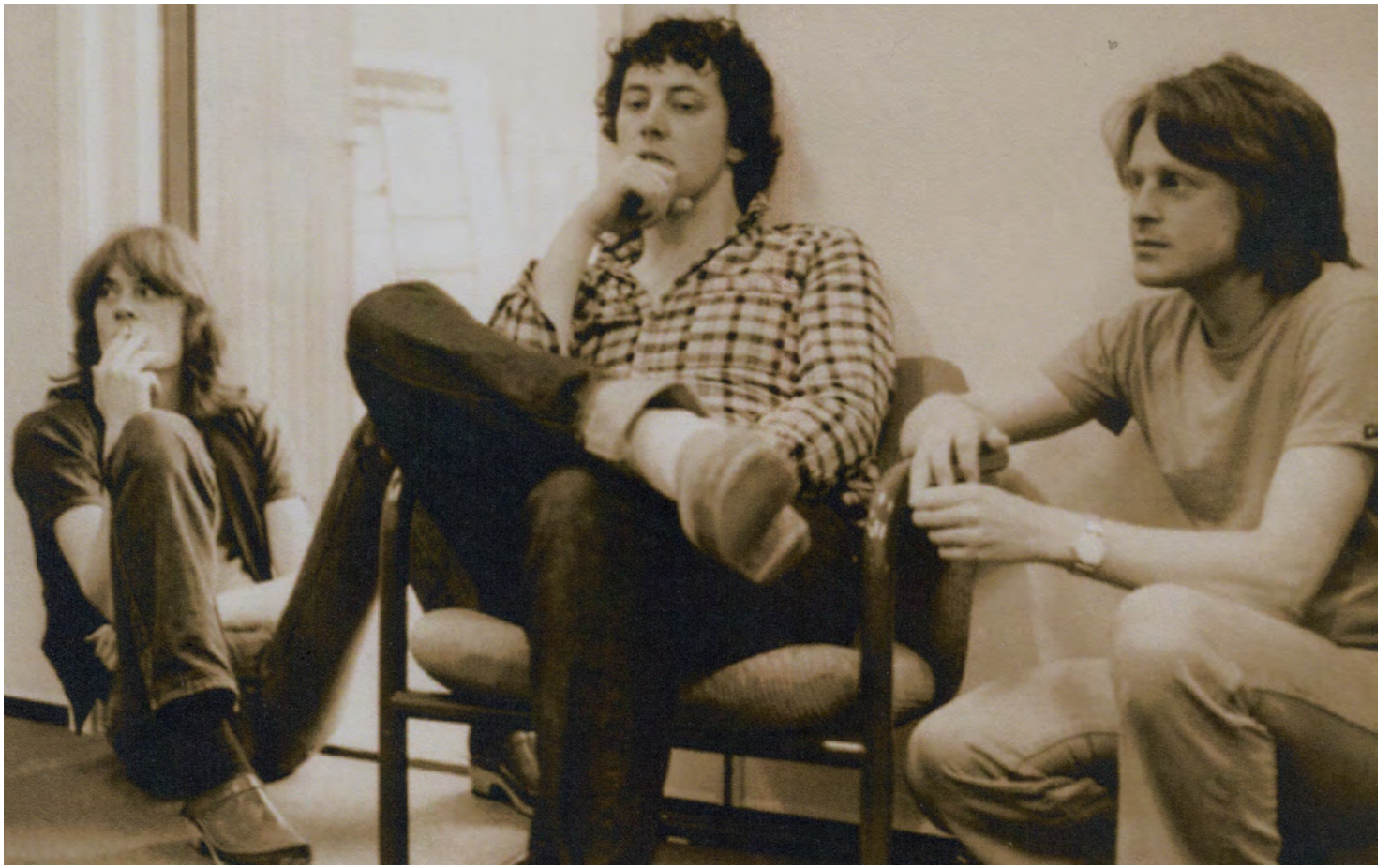
Kurskamrater på JH i samband med nåt möte