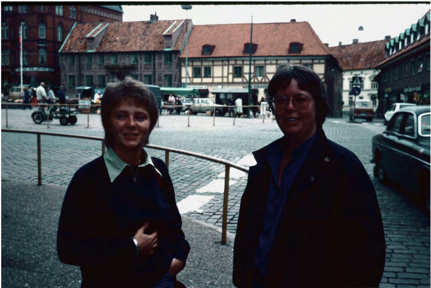
YA-VÄNNER & KOLLEGER