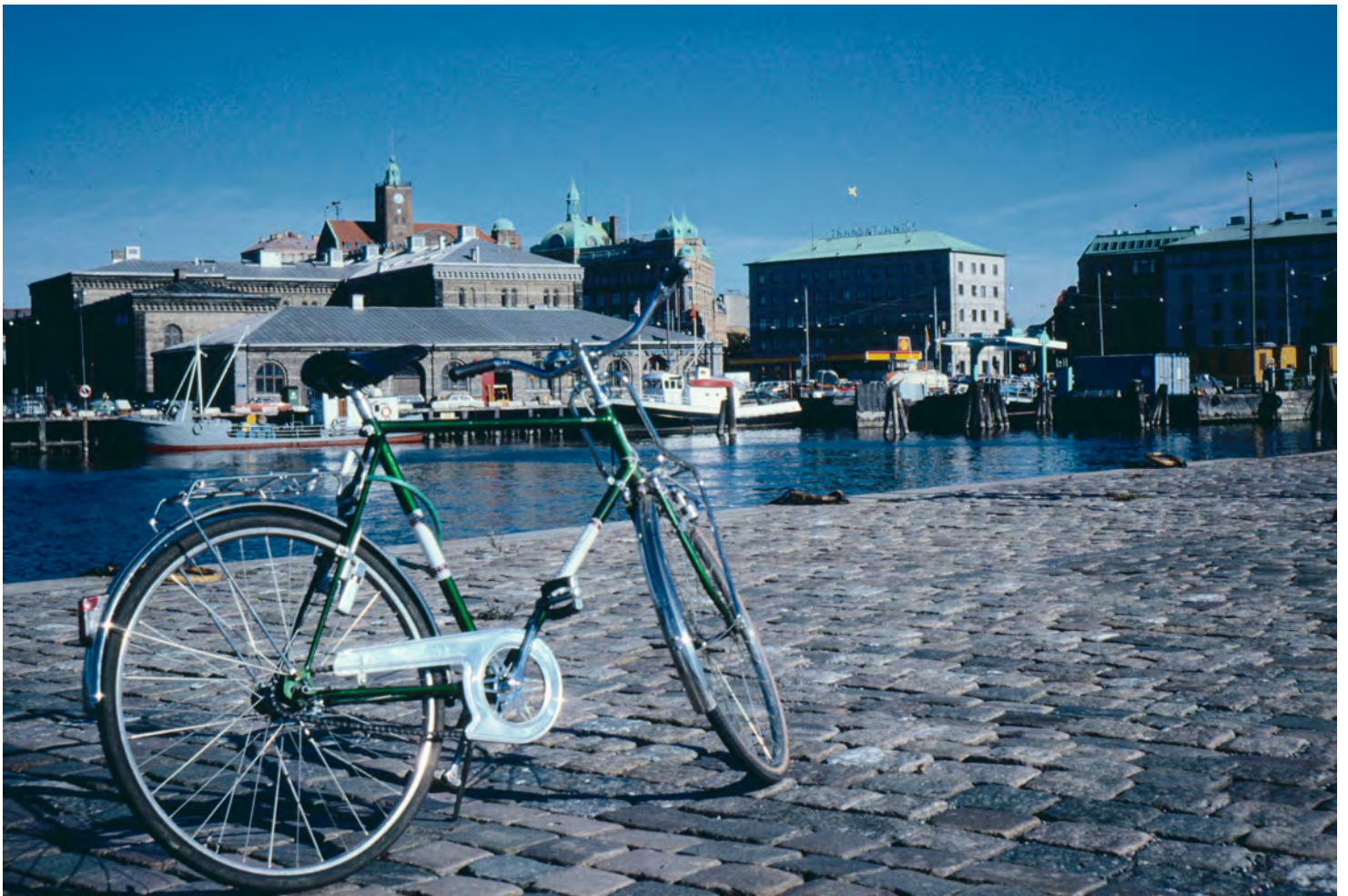
Cykeln redo för nya turer i och runt Göteborg. Här på Amerikapiren.