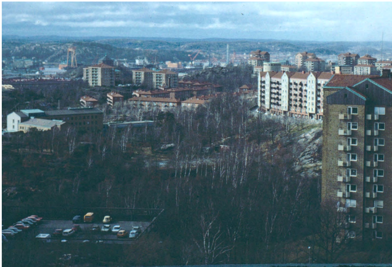
GÖTEBORG SETT FRÅN GULDHEDSTORNET OCH FRÅN SKANSEN KRONAN