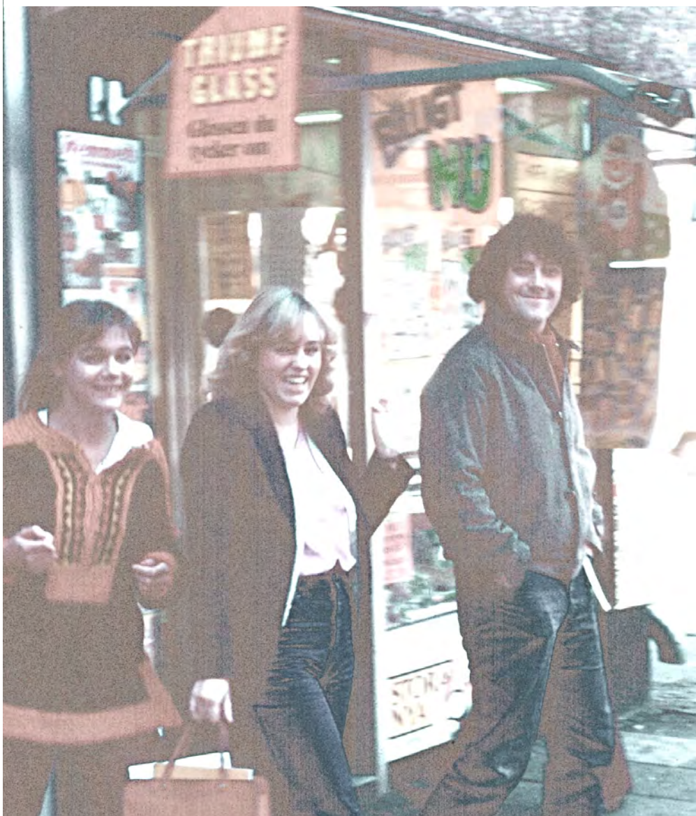
JHG PÅ ANDRA LÅNGGATAN