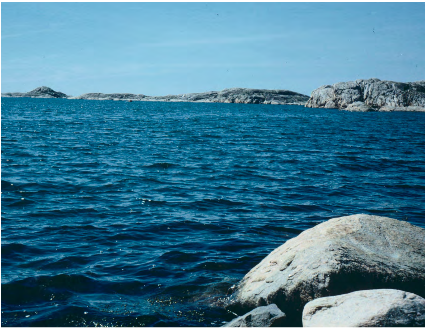
GÖTEBORGS SÖDRA SKÄRGÅRD