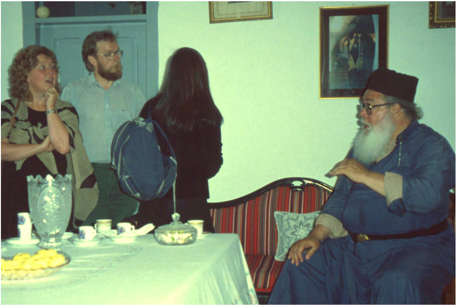
Fader Sariph i Khakel Dana-klostret, Silwan