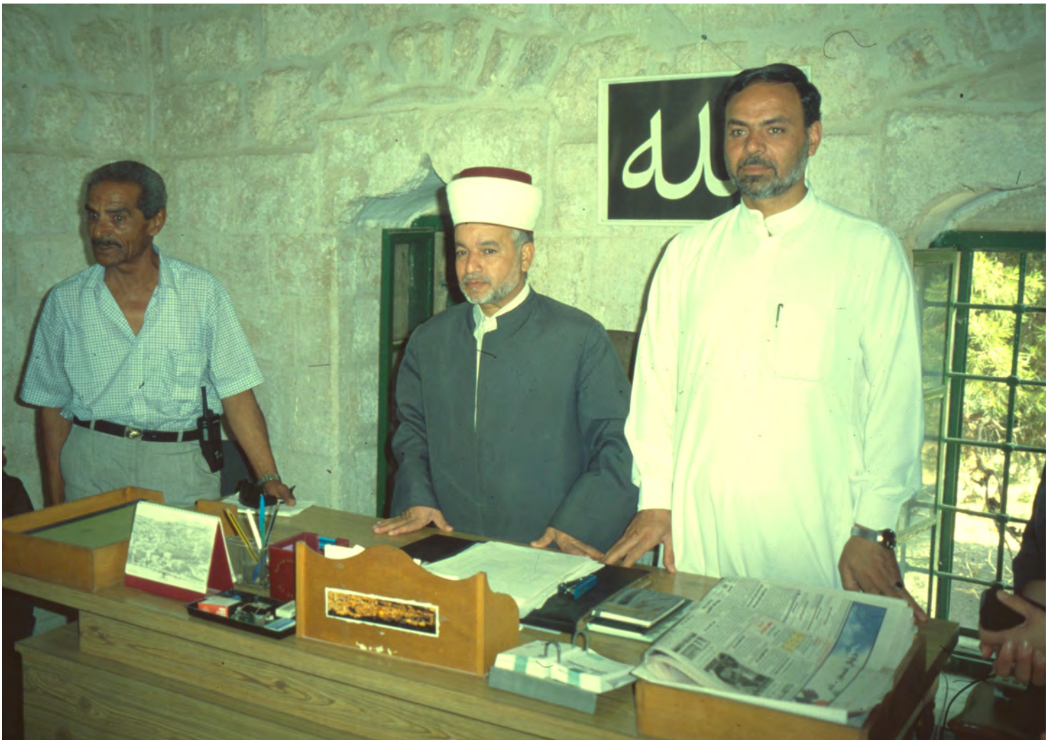
Studiebesök i Klippmoskén