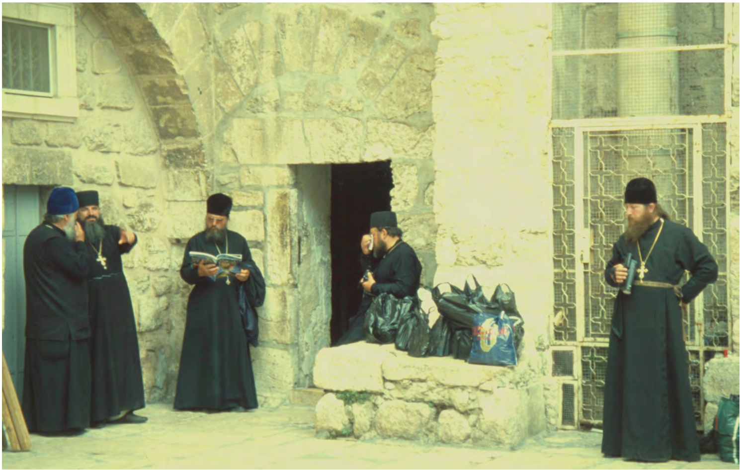
Den Heliga Gravens kyrka