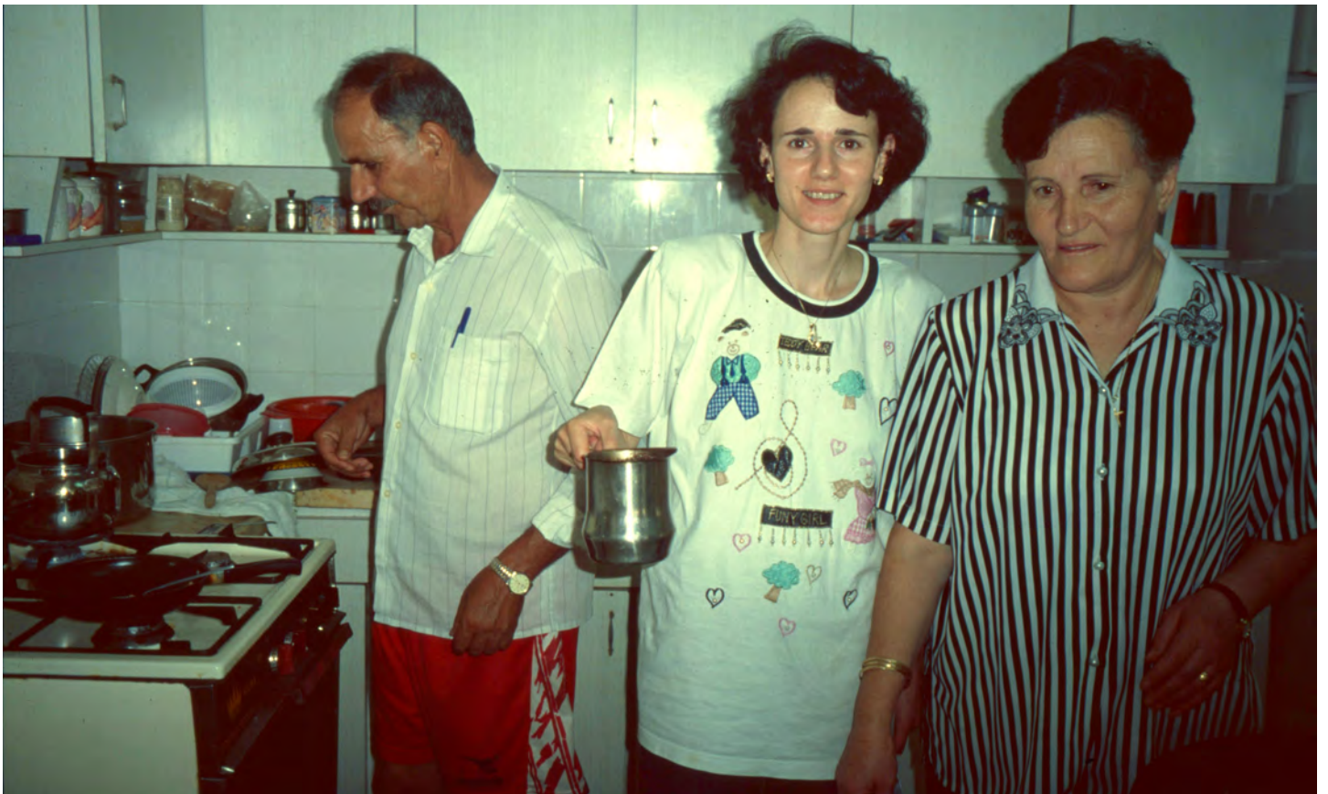
Lunch hos familjen Rishnawi genom alternativa turismprojektet