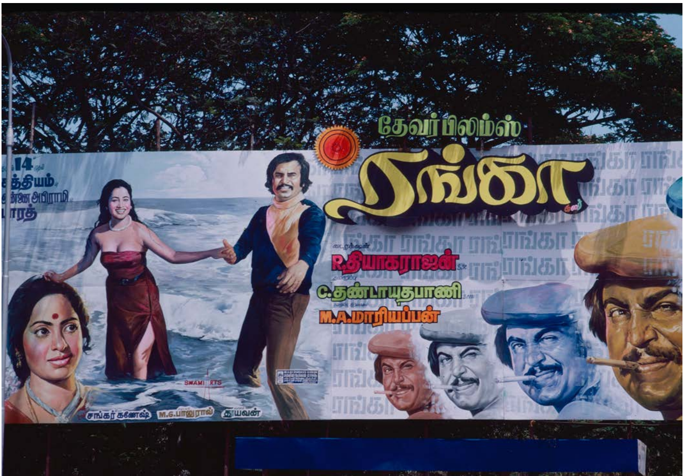
NÖJESLIV I BANGALORE.