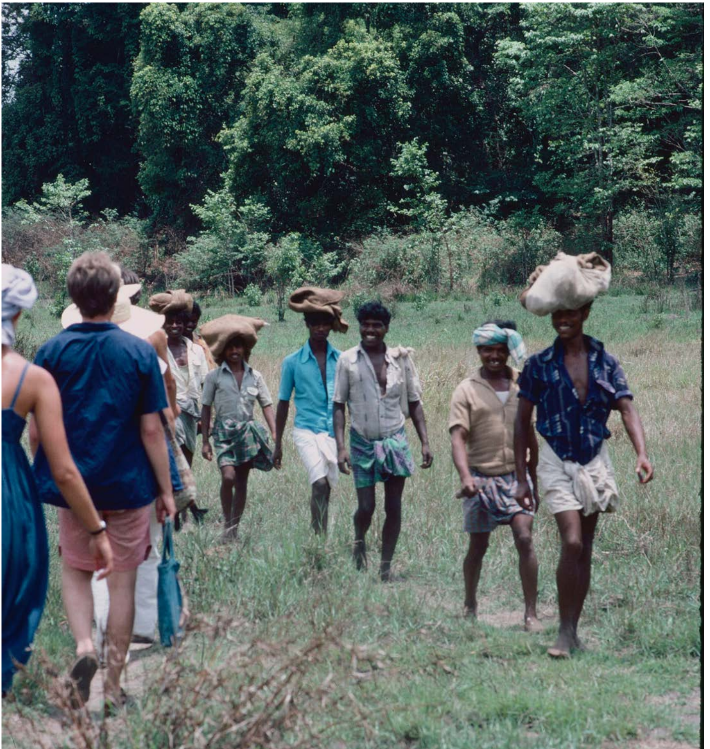
PERIYAR LAKE NATIONAL PARK.