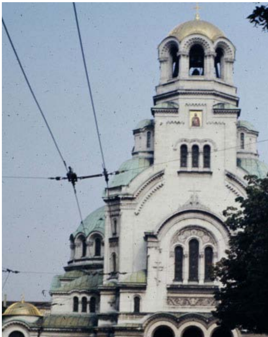
PÅSKFIRANDE I ALEKSANDER NEVSKIJ- KATEDRALEN