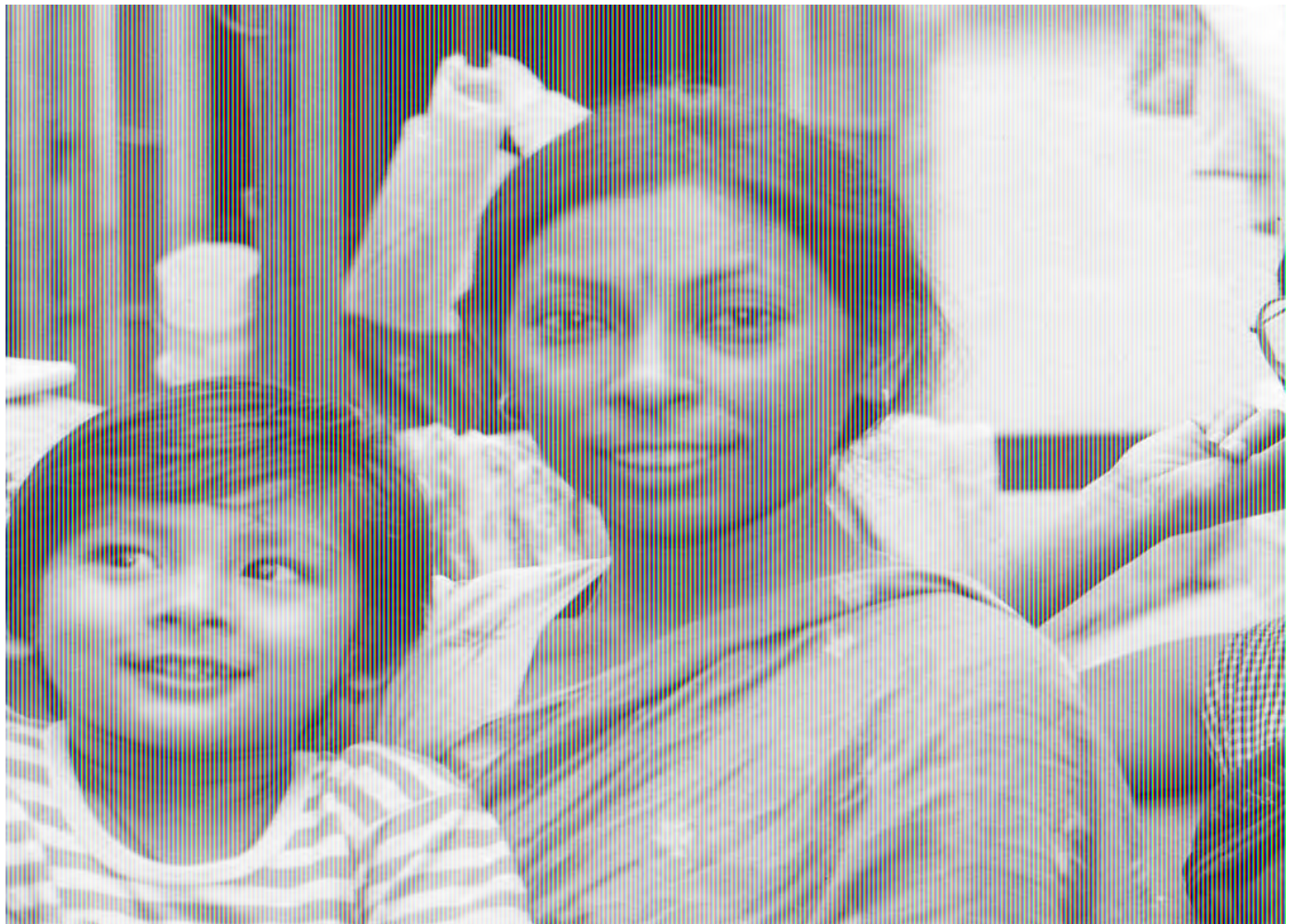
Bubu, Buku and Banjul