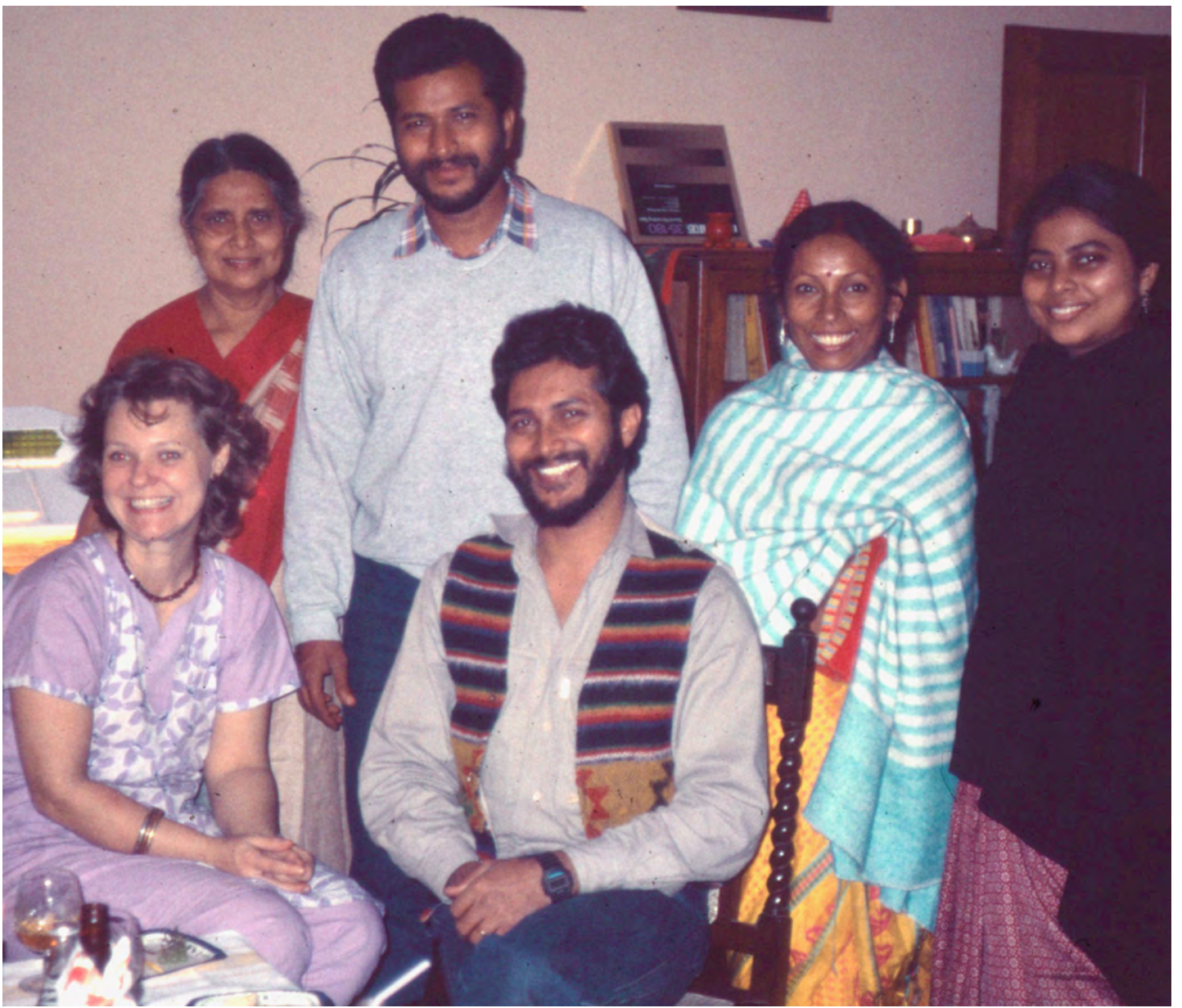
Dutt family at their Ritchie Road residence