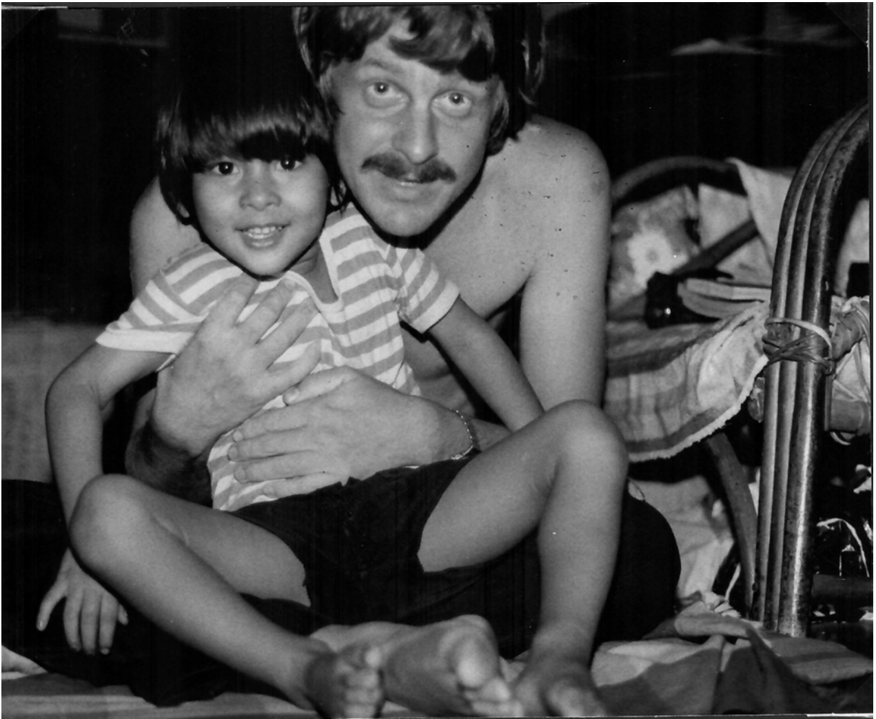
Las and Banjul