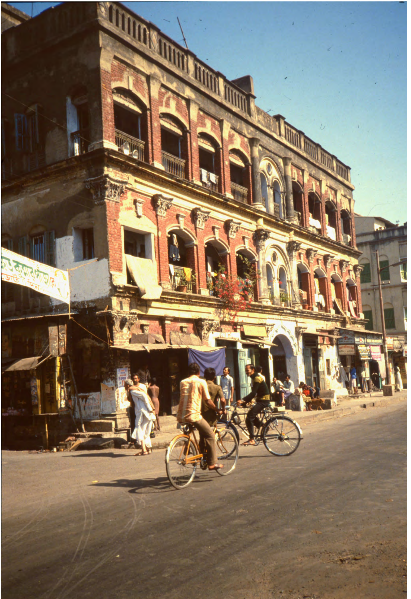
Paikpara, former house of Munshi family