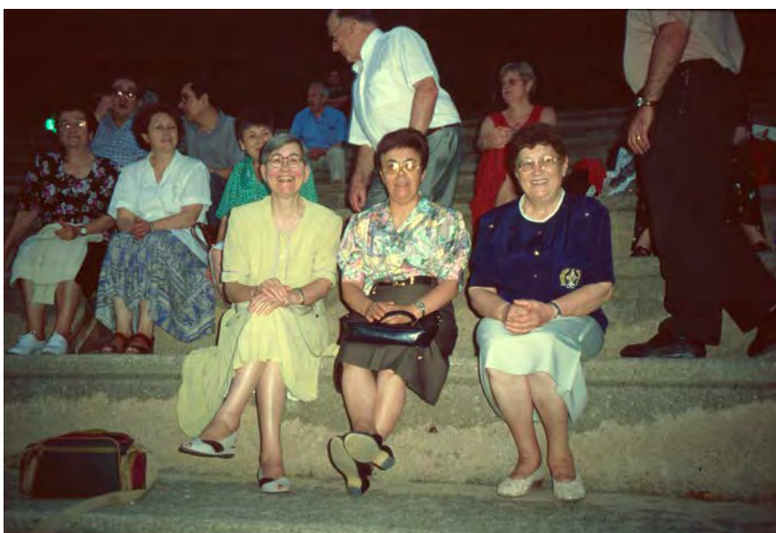
Nunnorna som tog hand om oss kom till vår konsert.

Det visade sig då att det finns ganska många Berga just i Sverige. Ett sådant ligger i Småland, i Högsby kommun, och kommunledningen där blev genast entusiastisk och nappade på Farguells kontaktsökande. Det ledde till att spanska Berga och småländska Högsby blev vänorter med ett omfattande samarbete inom många områden. Det uppförde till och med ett minnesmärke i Berga över en Högsbybo som omkom i Estoniakatastrofen 1994.