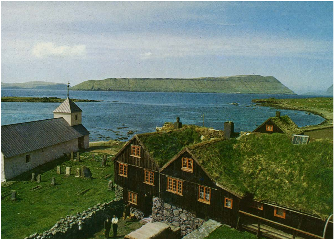
KIRKJUBØUR I GOTT VÄDER (VYKORT)