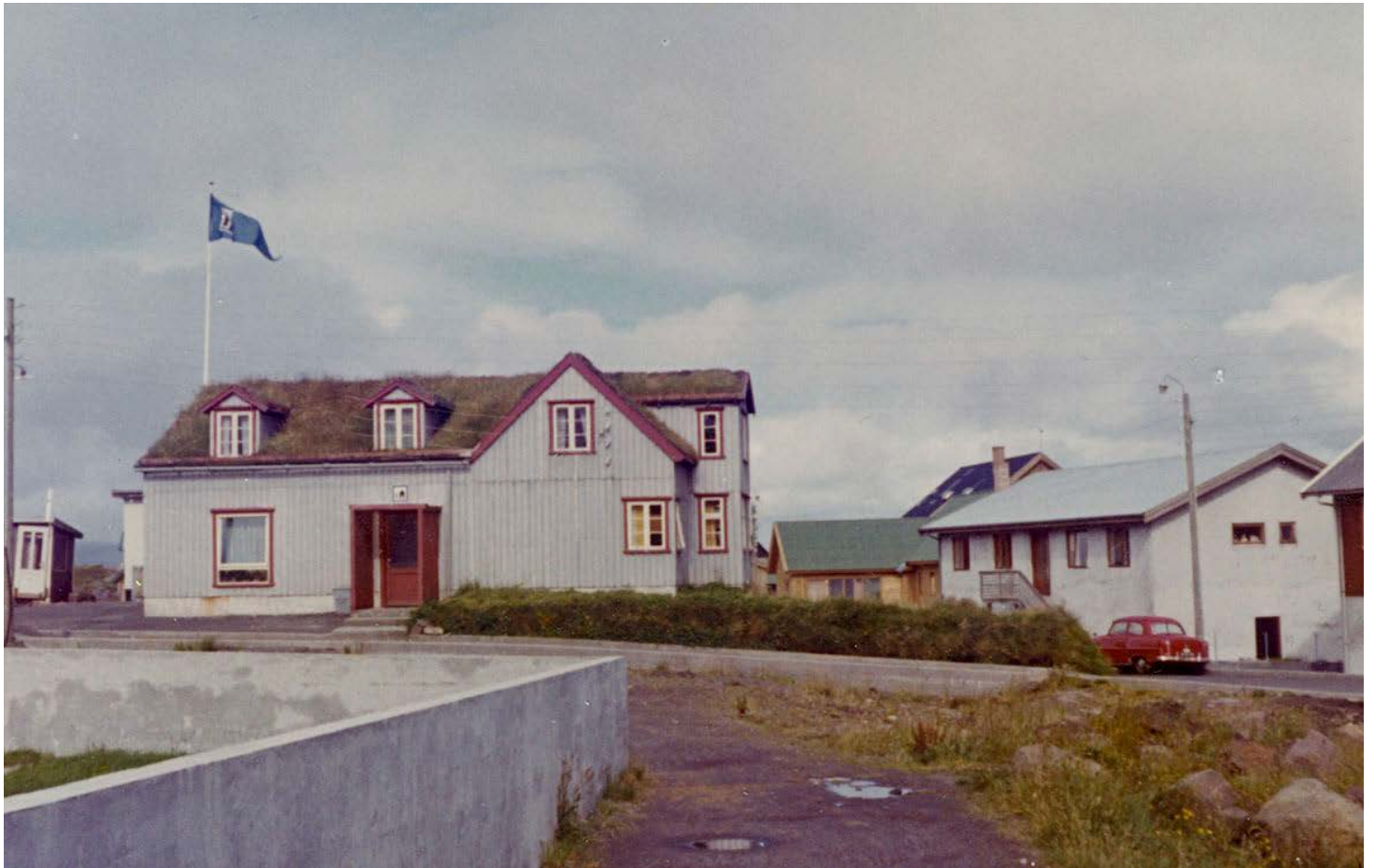
VANDRARHEMMET I TORSHAVN