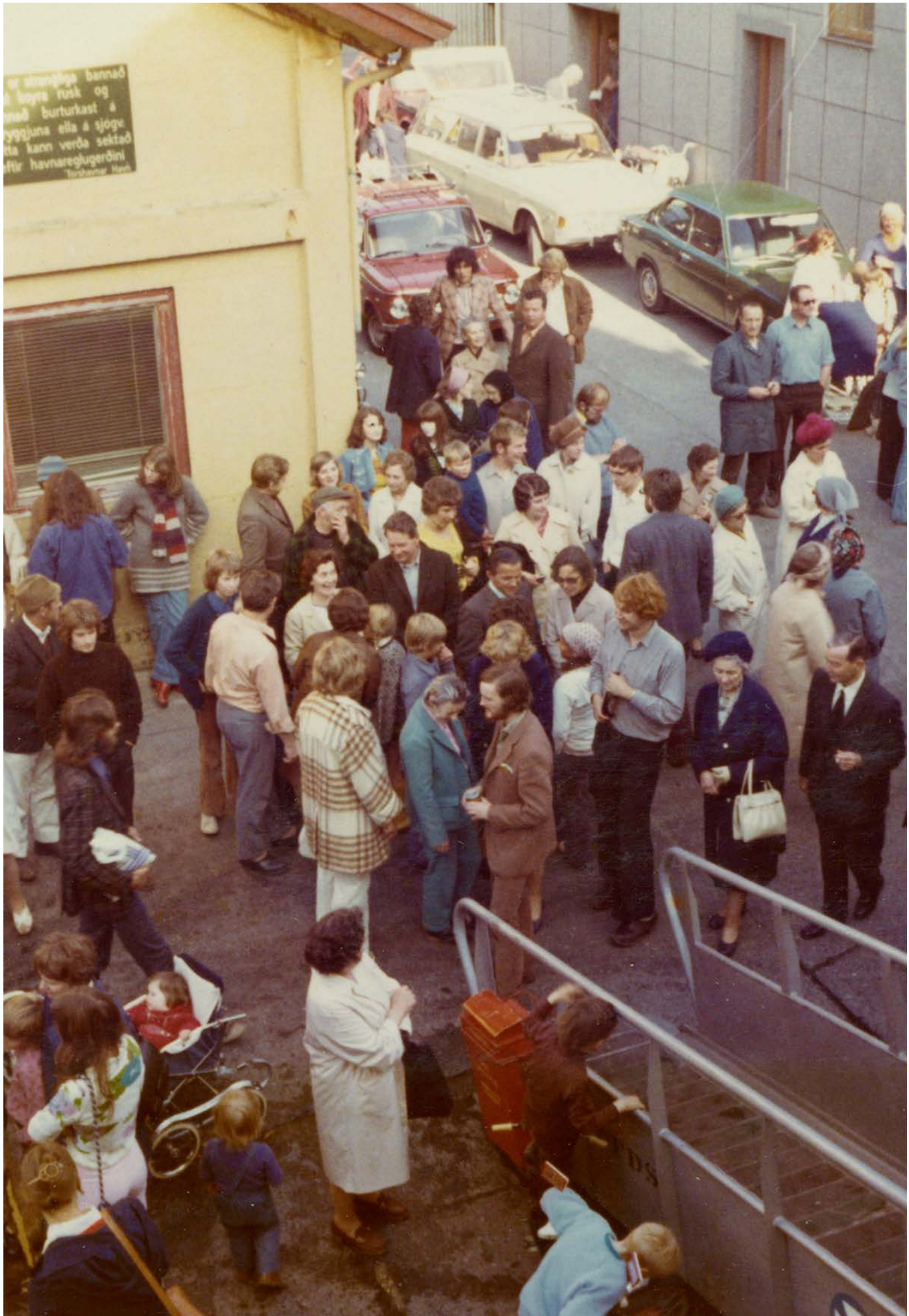
FÄRJAN FRÅN ESBJERG FRAMME I TORSHAVN