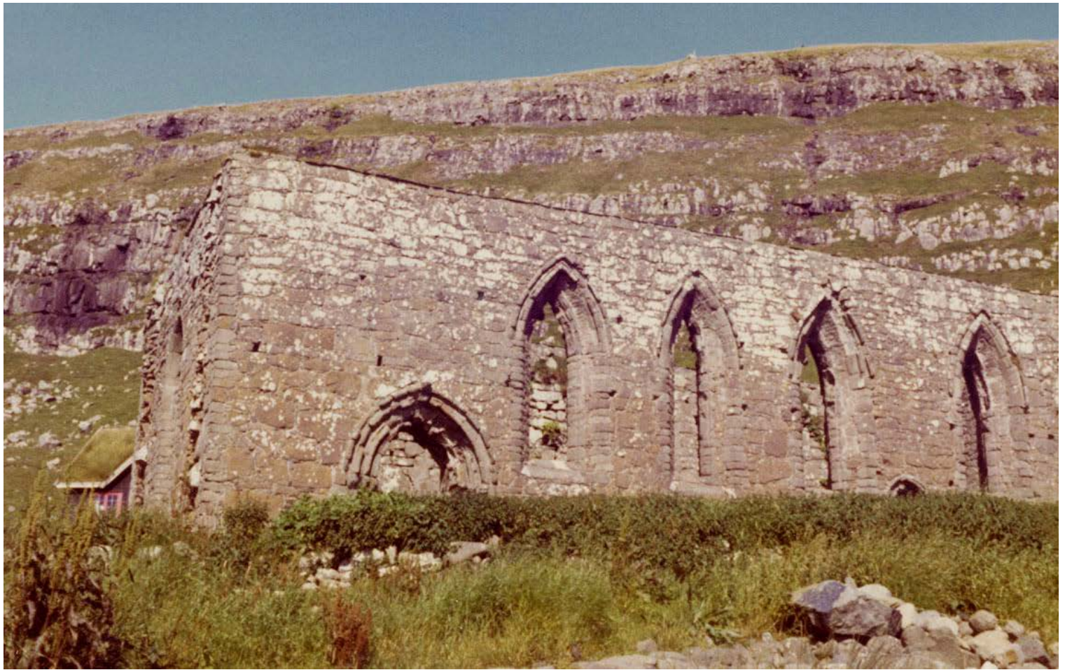
KIRKJUBØUR I GOTT VÄDER