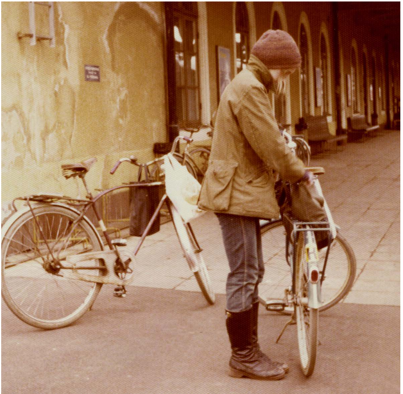
Cykeltur med start från He