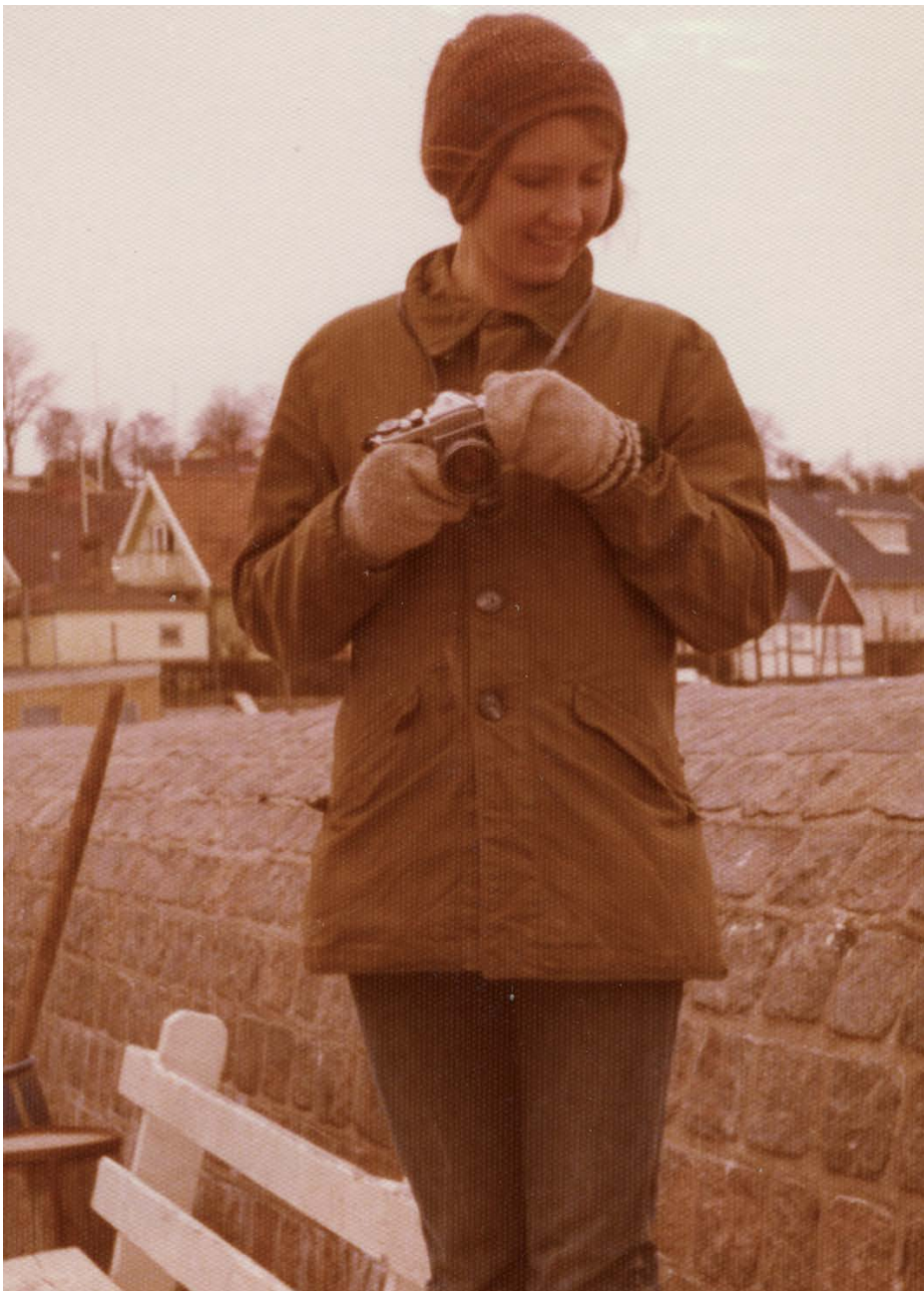
Framme i Arild