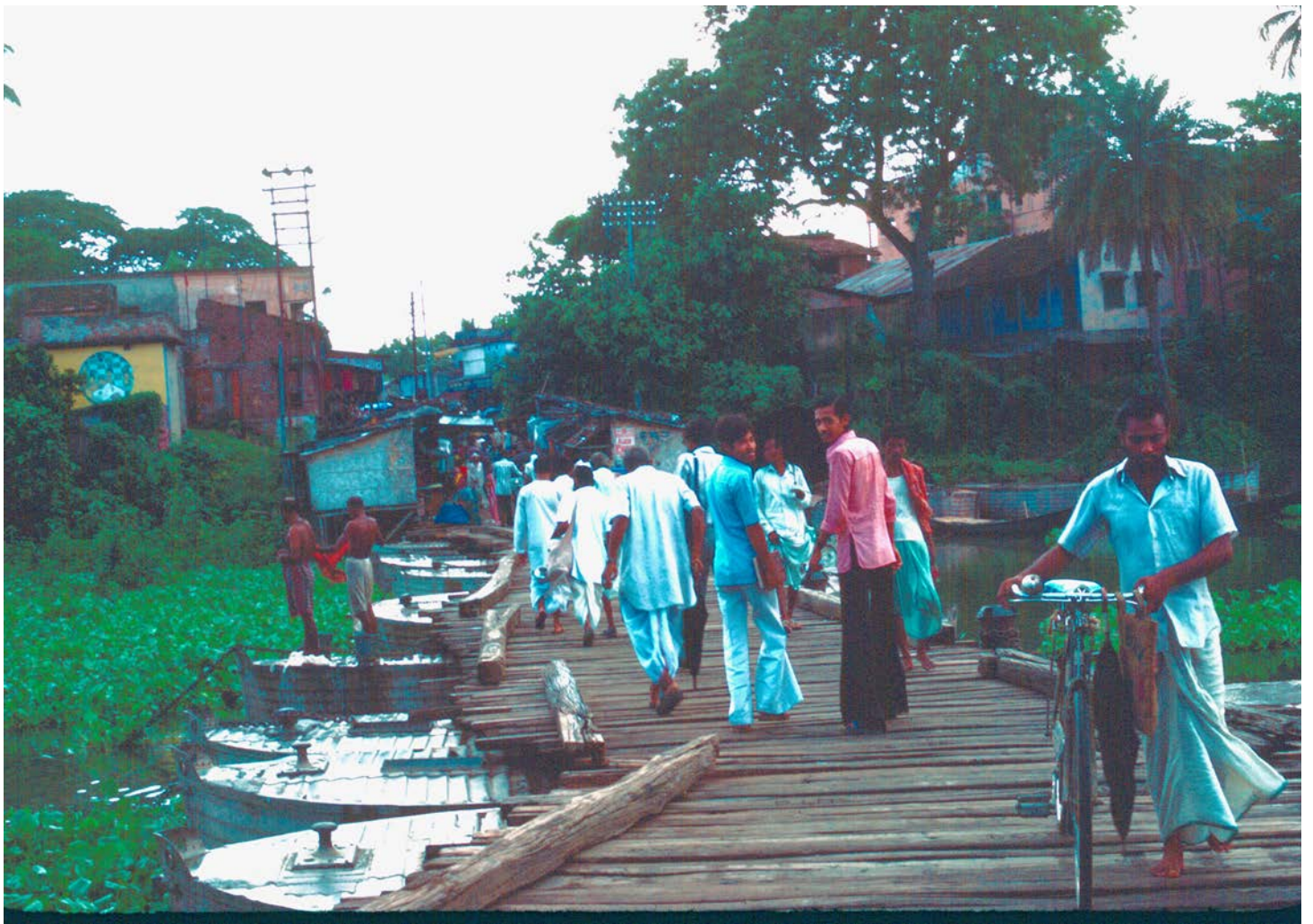
GRÄNSEN BANGLADESH-INDIEN VID BENAPOLE