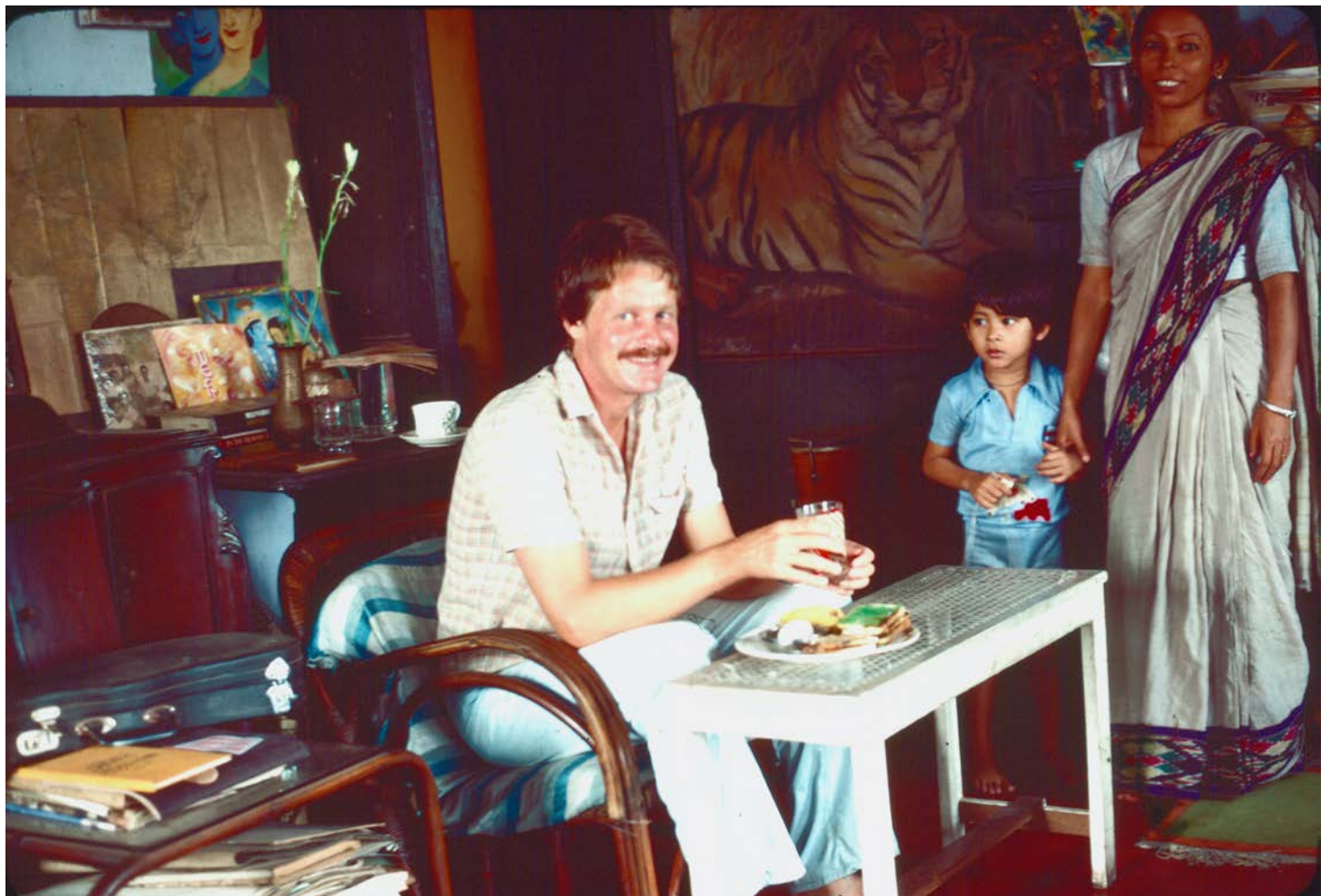
HEMMA I CALCUTTA