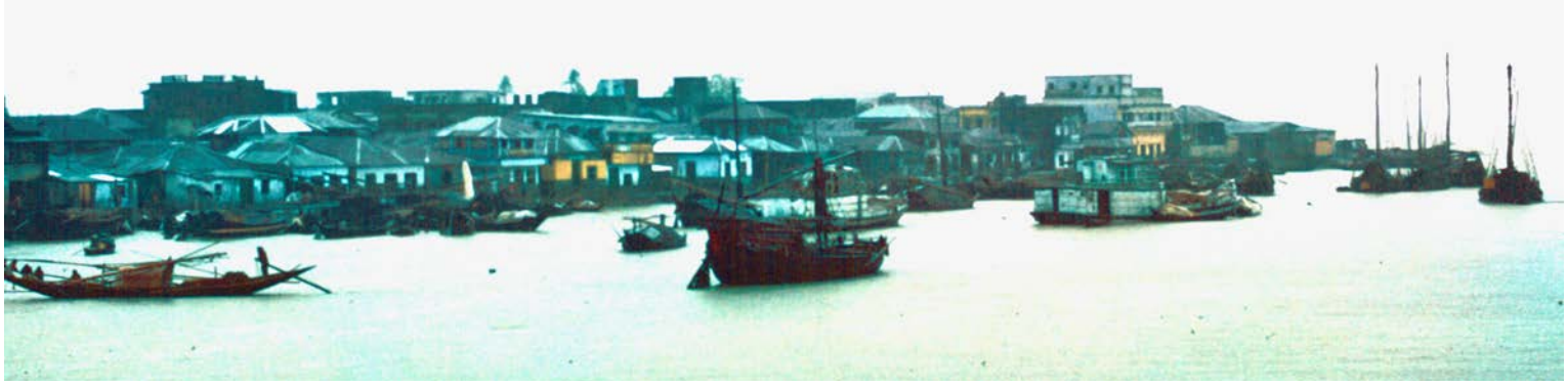
FÄRD MED THE ROCKET FRÅN DACCA TILL BARISAL