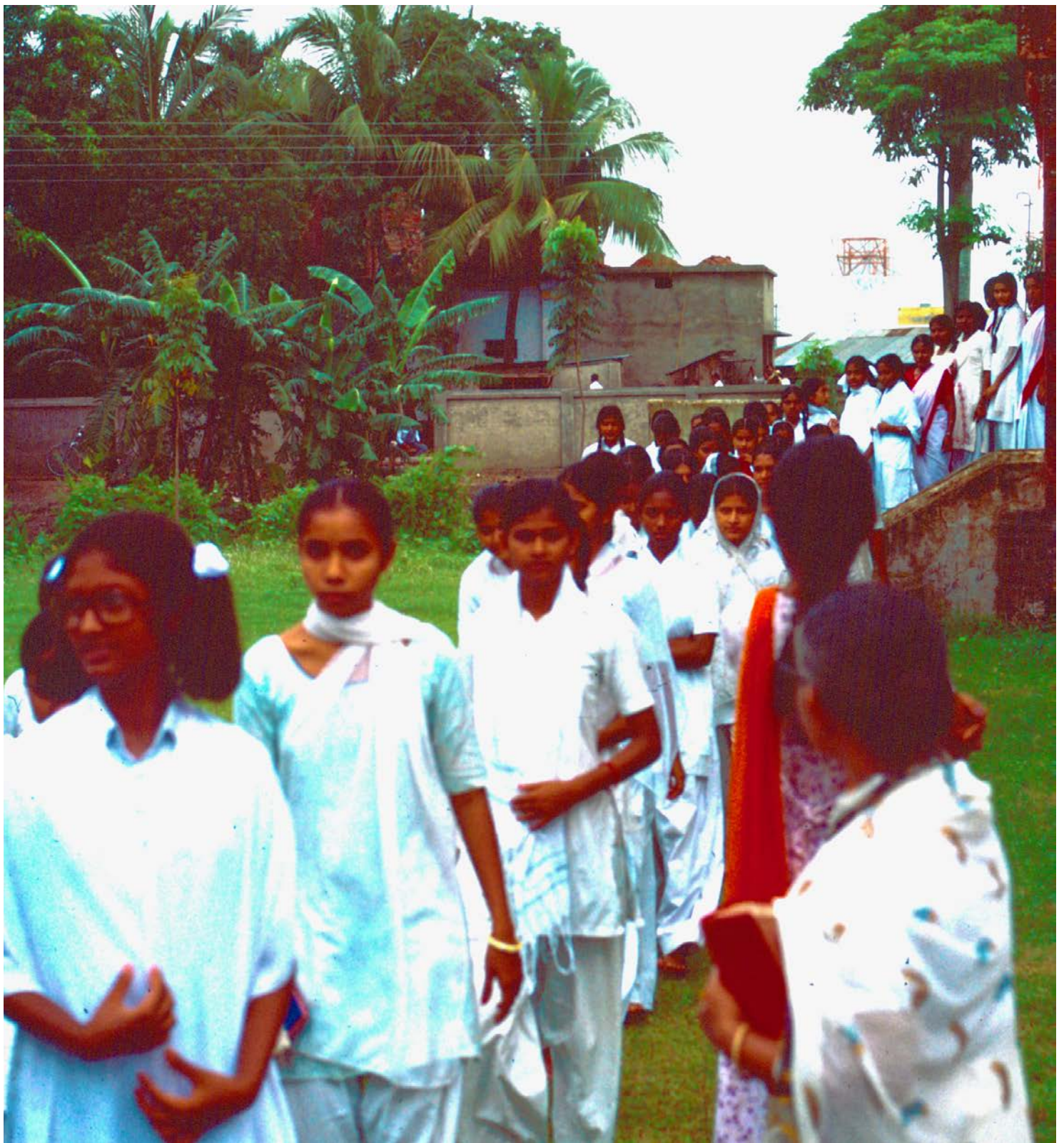
Baptist Mission i Barisal