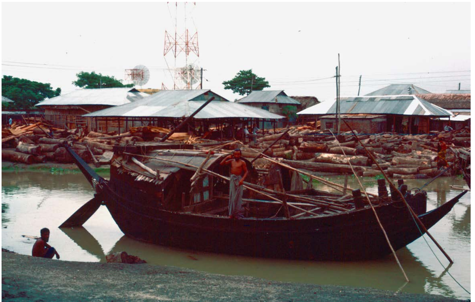
PÅ VÄG MOT KHULNA MED THE ROCKET