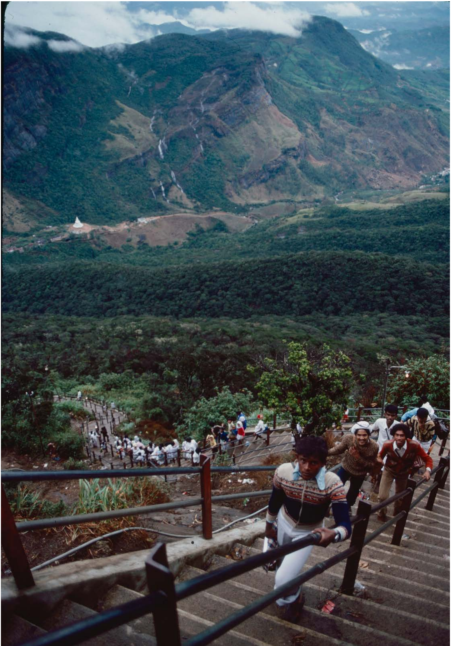
På väg uppför Adam's Peak, pilgrimsmål för såväl buddhister, hinduer, muslimer och kristna