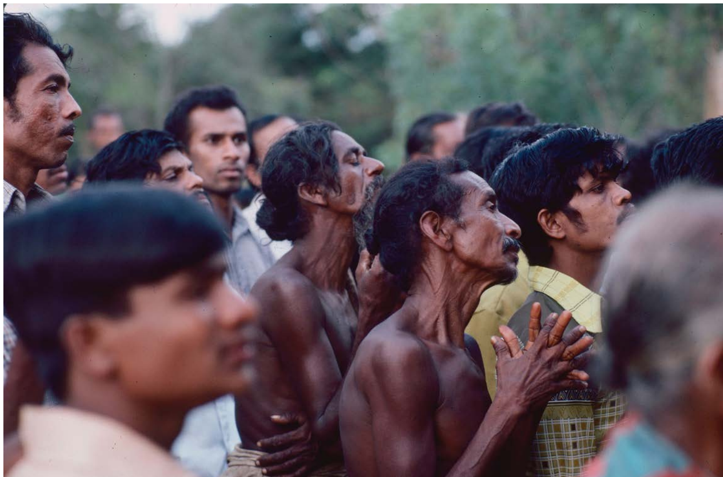
Protestmöte mot planerad tvångsförflyttning