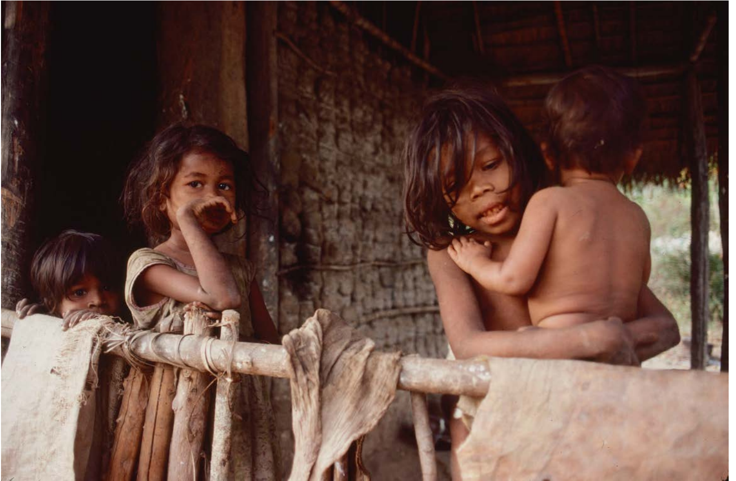
Veddahs i byn Mahiyangana