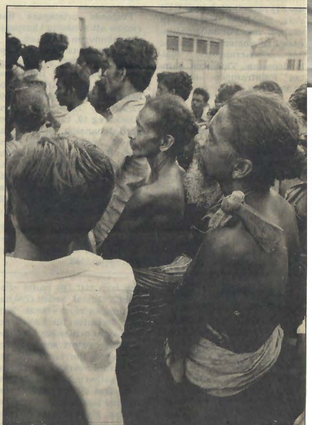
Två veddahs med karakteristisk hårklut och yxa över axeln har begett sig till ett möte där den lokale parlamentsledamoten ska tala. Veddahs ska kräva att han fortsätter kämpa för deras rätt att bo kvar i sin djungel fastän den ska ingå i en ny nationalpark. Yxan används av veddahs för att gräva ut honungen i träd i djungeln, där vilda bin har sina bon.