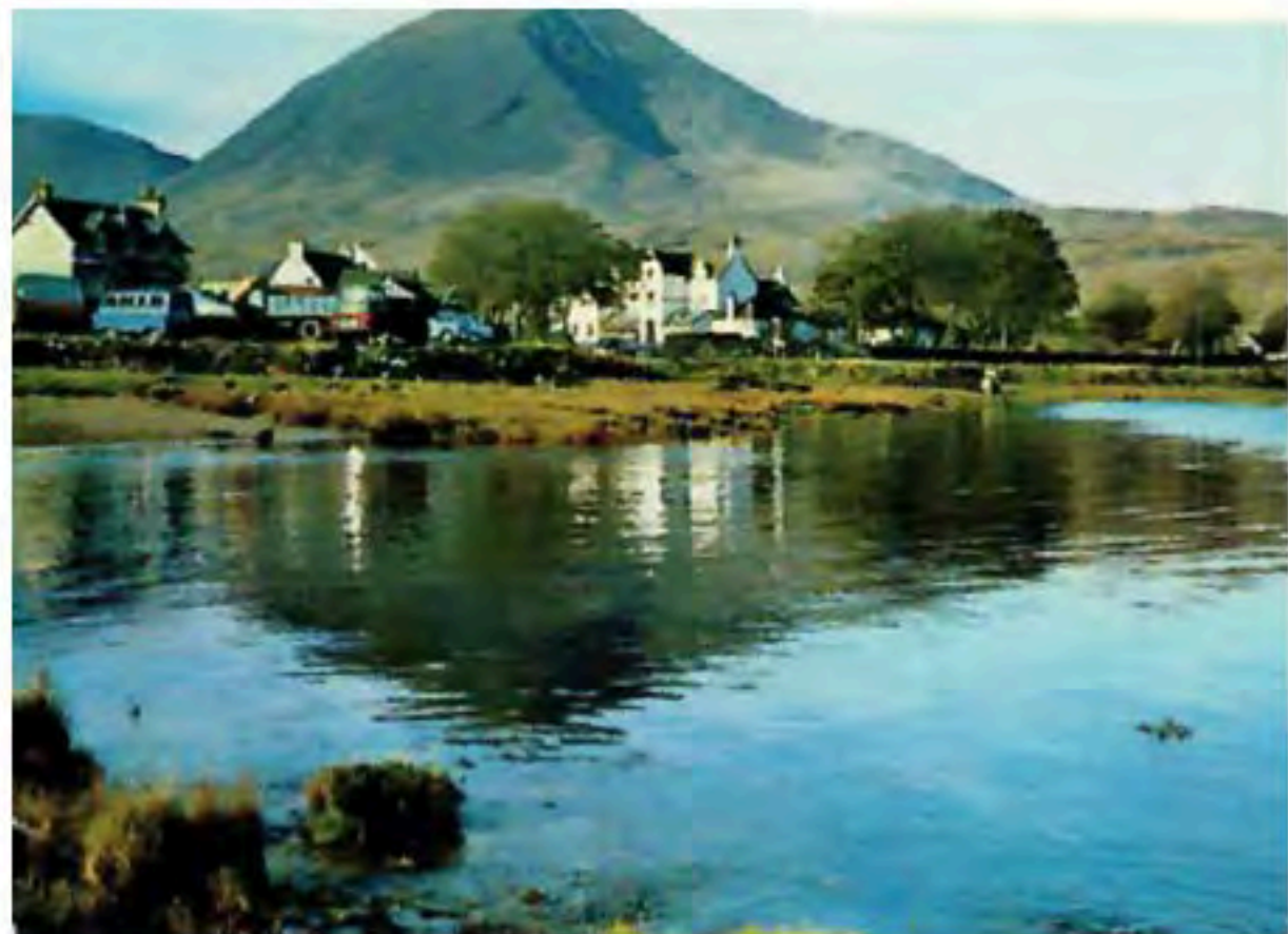
Isle of Skye