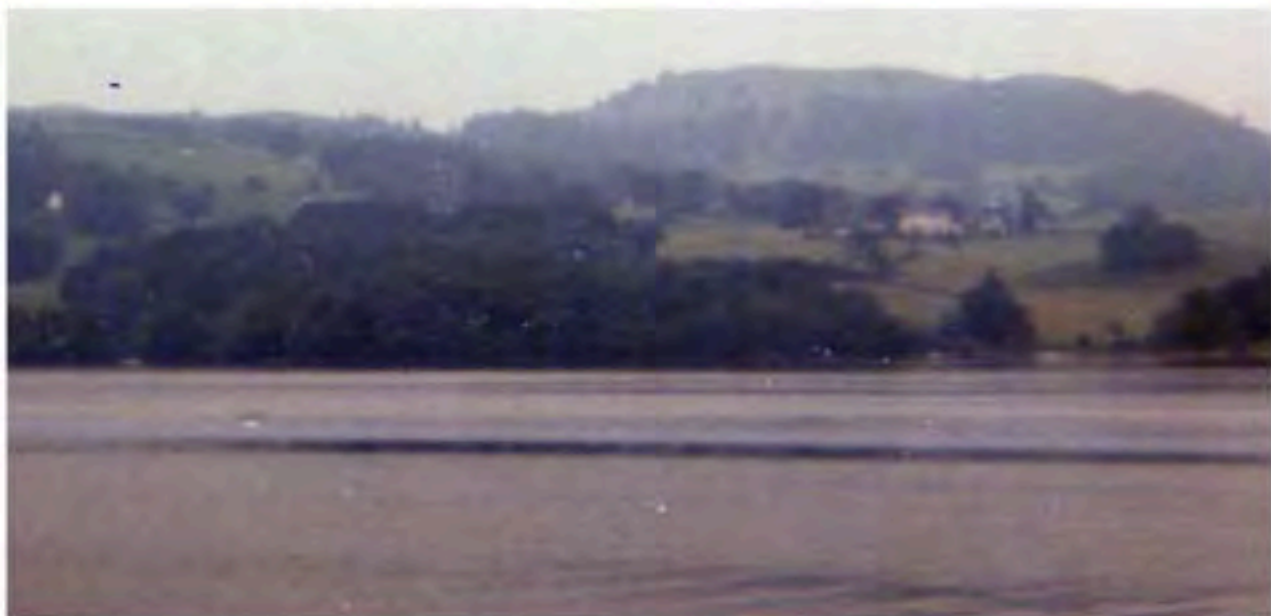
Windermere, Lake District