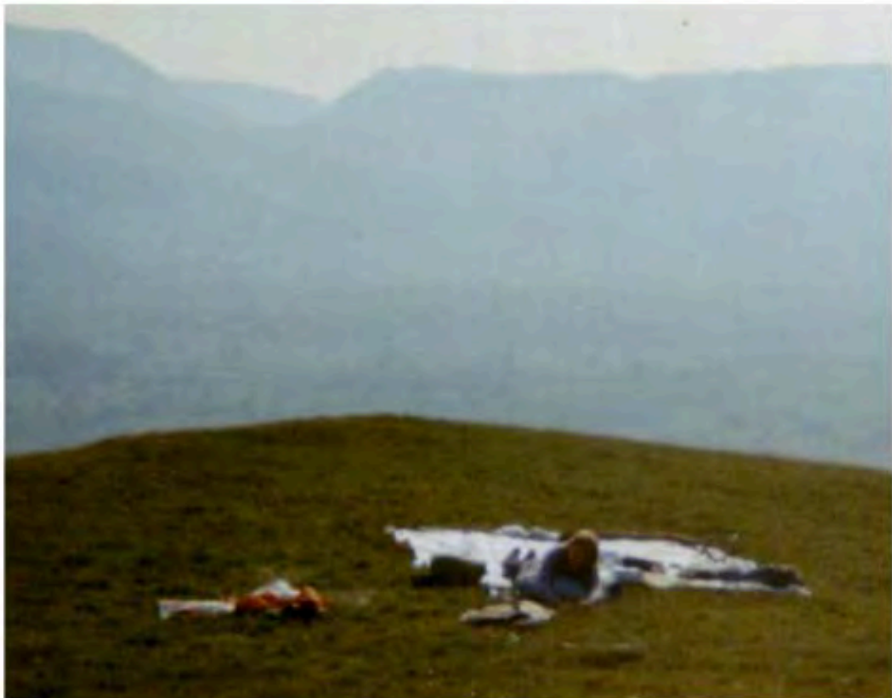
Övernattning i det fria vid Keswick