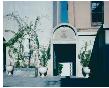
ANANIAS KAPELL I DAMASKUS förknppad med Saulus omvändelse till kristendomen och hans nya identiet som Paulus