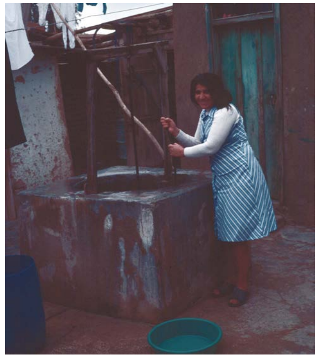
JUNIAH med väninna