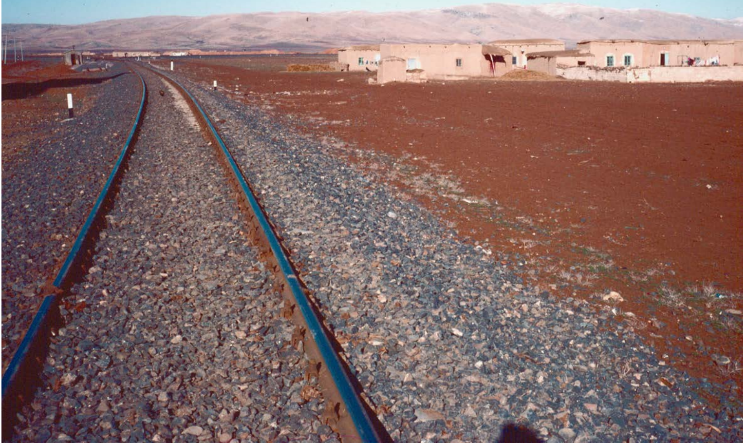
'THE EUPHRATES VALLEY RAILWAY