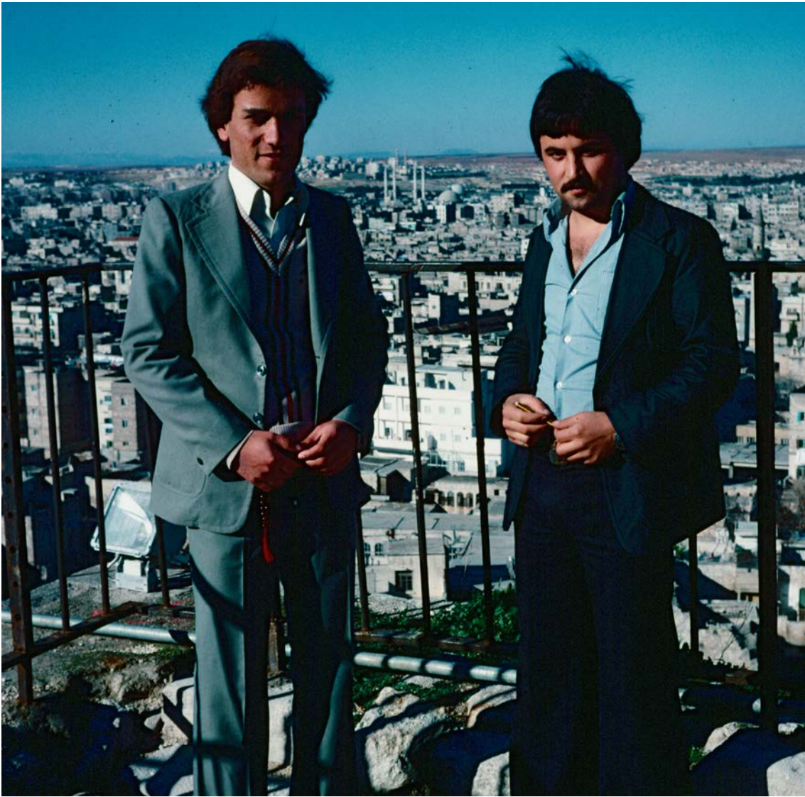
STUDENTER PÅ HANDELSHÖGSKOLAN I ALEPPO – kurder från Qamishliye som jag lärde känna på Citadellet