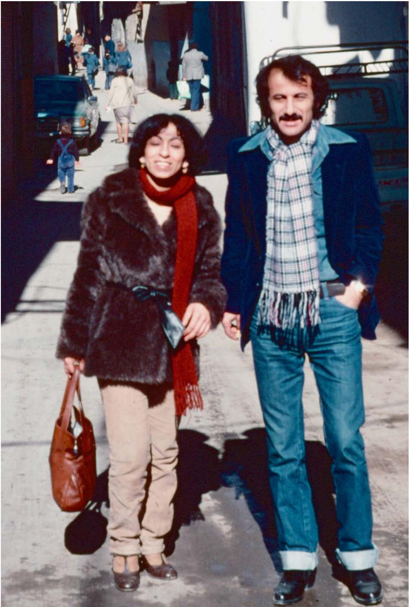
JOUNIAH och PAULUS i DAMASKUS