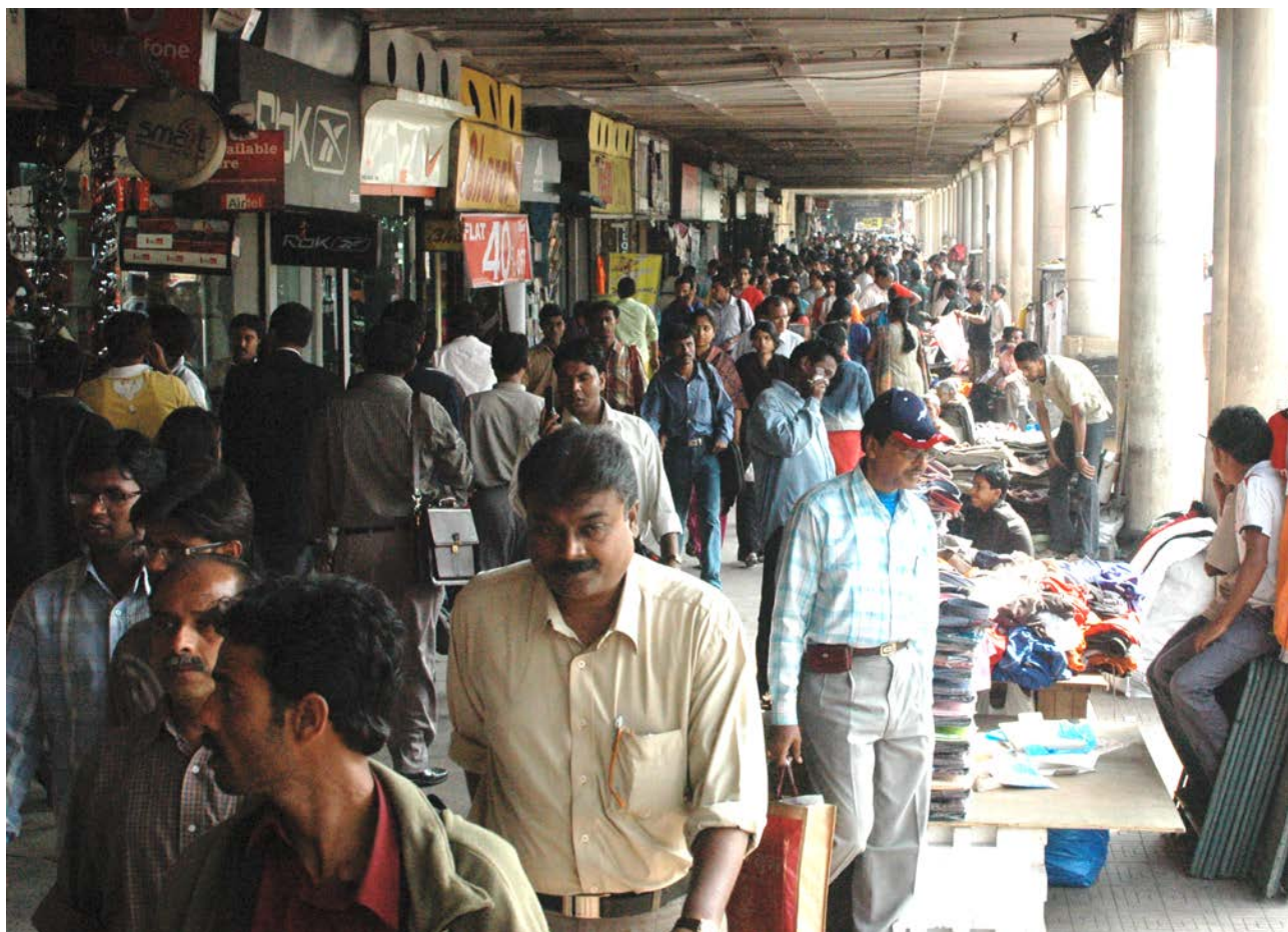
Gatumarknad utanför Grand Hotel i Calcutta