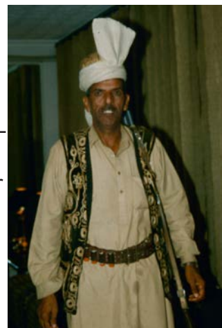
Vakt på Falettis hotell i Lahore

Och när jag sedan fick problem med att växla svenska kronor här i Calcutta och det heller inte gick att ta ut pengar med Visakortet blev vi bekymrade och därav vädjan om att skicka lite extra kontanta dollar så att vi åtminstone har pengar till flygplatsskatten och hotellet i Nepal på hemvägen. Sen har jag dock kunnat växla mina svenska kronor på ett annat ställe, och hittat en bankautomat som utan att tveka spottade ut rupees dragna från mitt svenska lönekonto, så någon ekonomisk kris är det inte längre tal om.