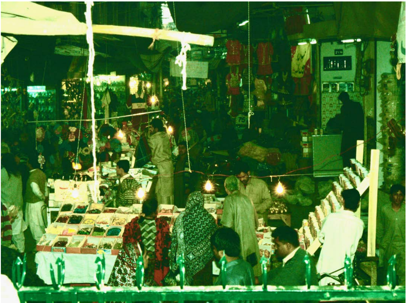
Islamabad bazaar in the evening at 10 PM