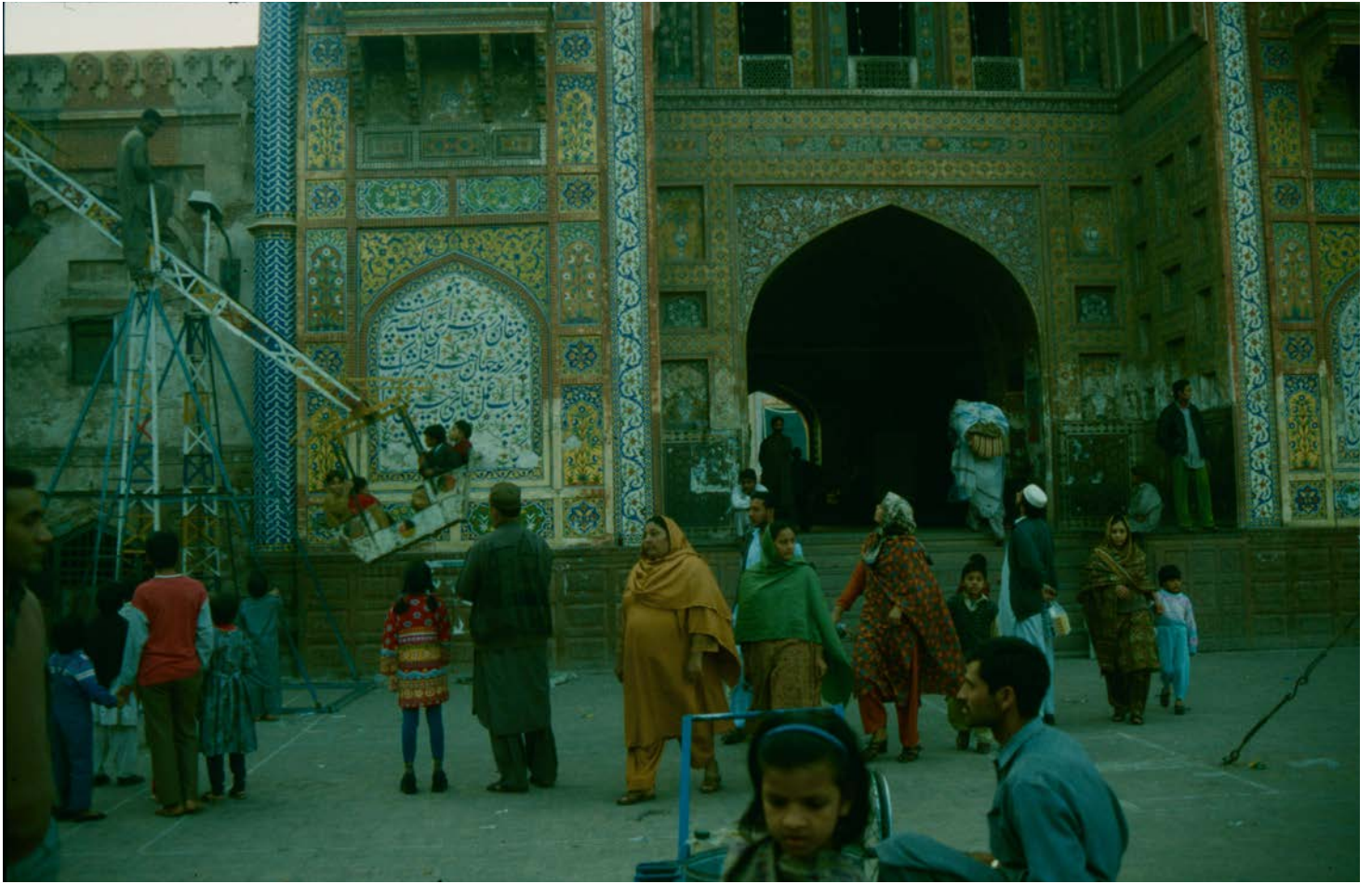
Old city Lahore