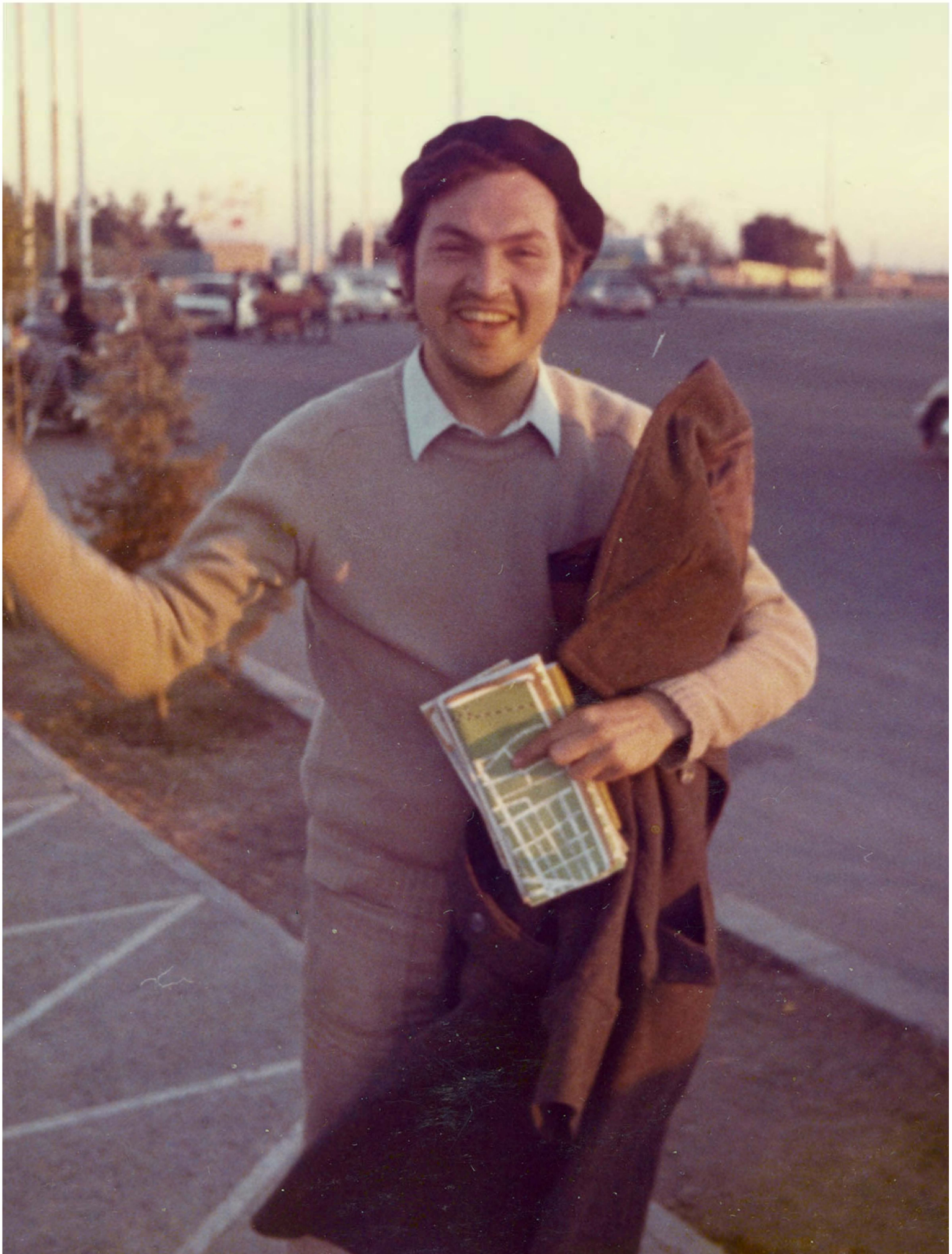
Tulio från Mexiko