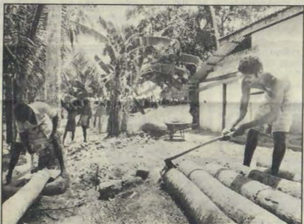
Elevhemmet vid Kirimetimulla är inte färdigbyggt. Elever- na från närbelägna byar är de enda som än så länge jobbar vid skolan.