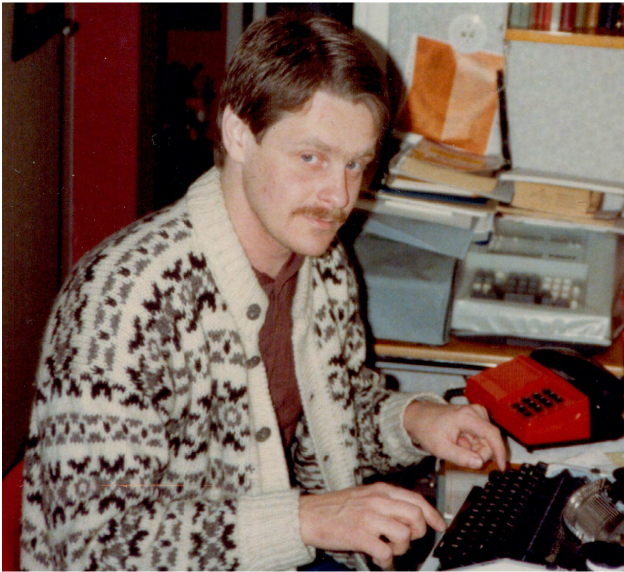
Avfärden stundar, testar nya reseskrivmaskinen hemma hos föräldrarna i Lund