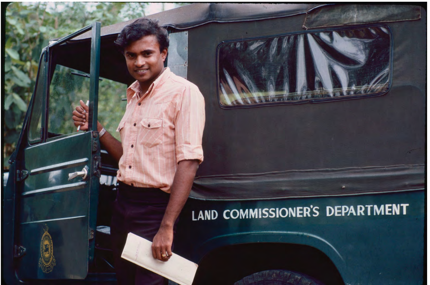
Besökte landsbygdsutvecklingsprojekt stöttt av Sida i Matara på sydkusten.