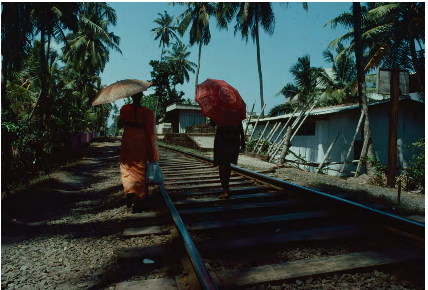
Sri Lankabilderna