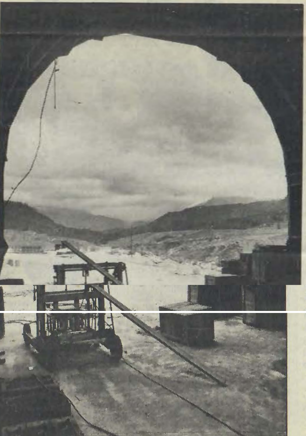
Utsikt från en av de väldiga tunnarna vid Kotmale där vatt- et från dammen till tunnarna, 7 km längre bort, kommer tt forsa fram.

S edan 1979 har Sida varit med om att finansiera ett brett upplagt program för att utveckla Mataradistriktet i södra delen av landet. Det är ett stort distrikt som sträcker sig från kusten med fiskebyar och kokospalan- tagar, ända upp till höglandet och te- plantagerna på 1.000 meters höjd.