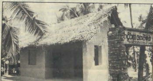
Mönstergården vid lantbruksskolan Johnydale visar möjlig- heterna för utbildade bönder att ta vara på och bruka jor- den väl. Ett rum och kök är idealet för en mindre familj.