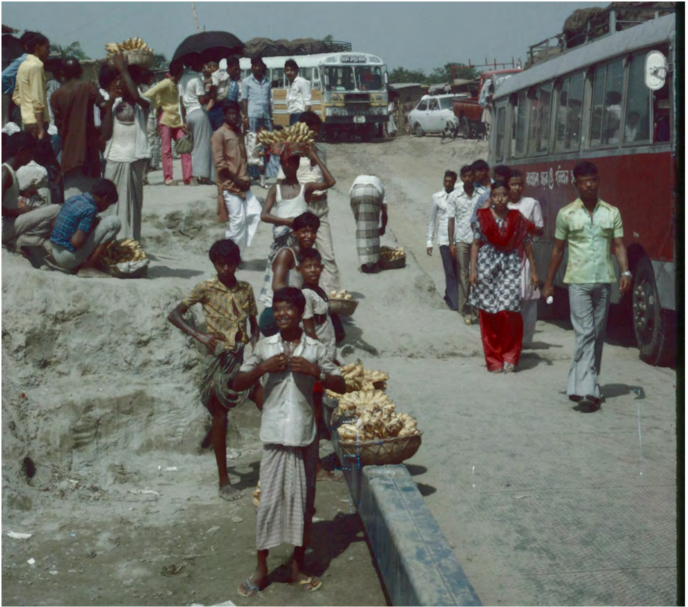
Färja över Brahmaputra-floden på vägen mellan Bogra och Dhaka.