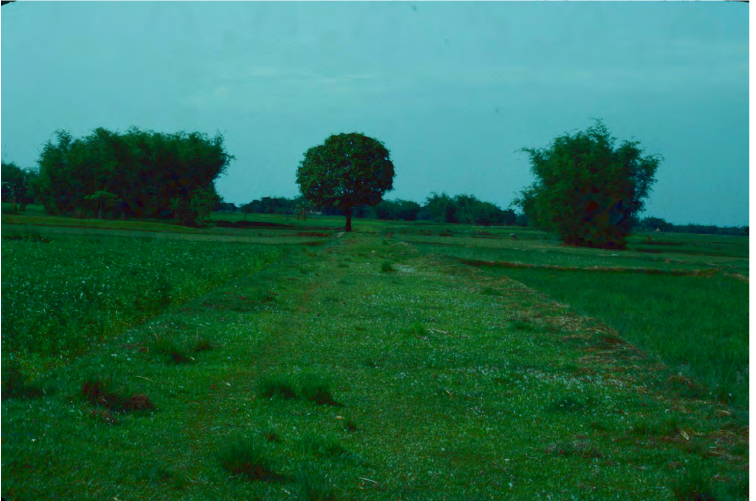
Samma frodiga gröna landskap på båda sidor av den omarkerade nationsgränsen