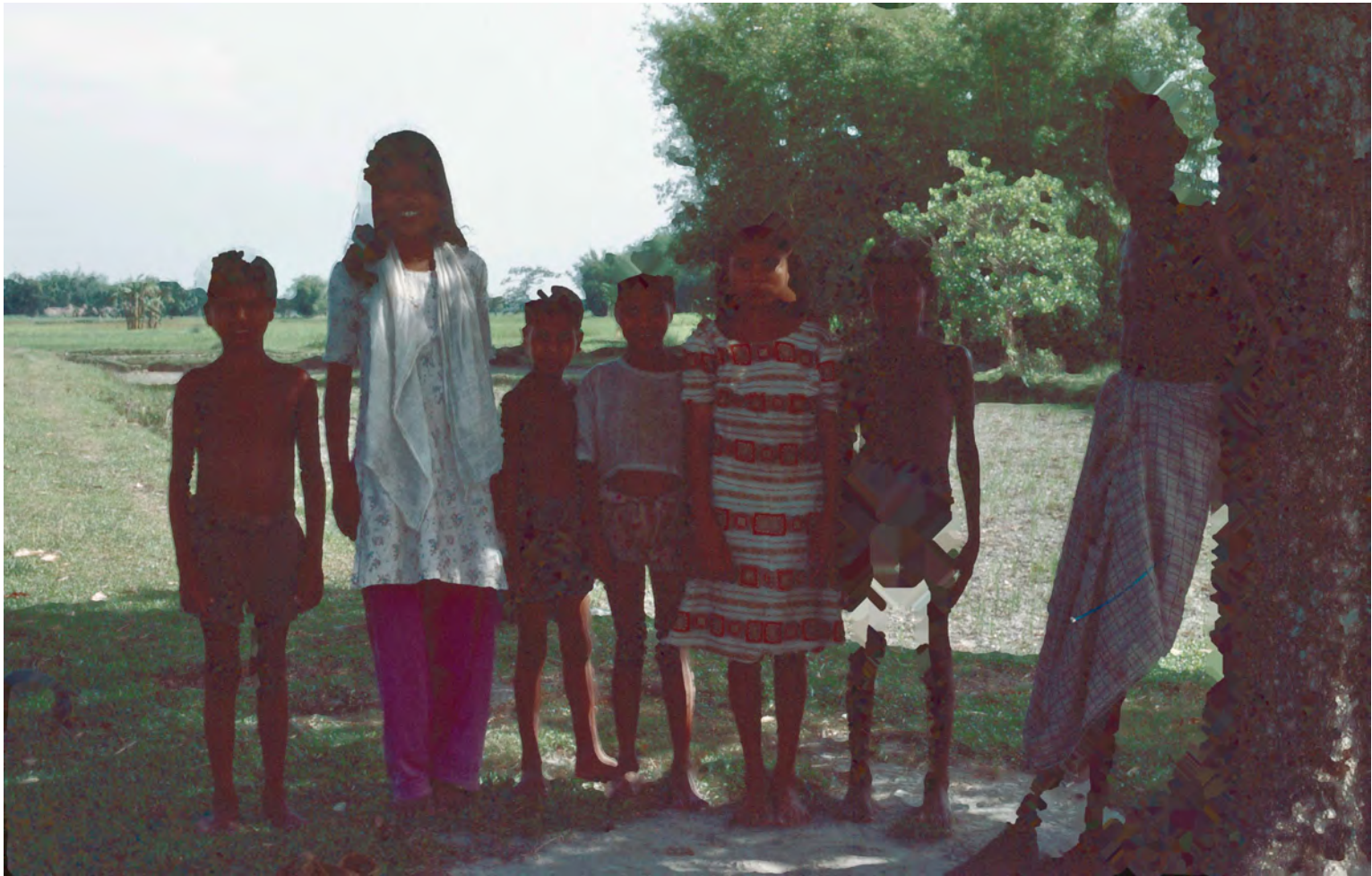
Bybor i ingenmansland mellan Indien och Bangladesh.