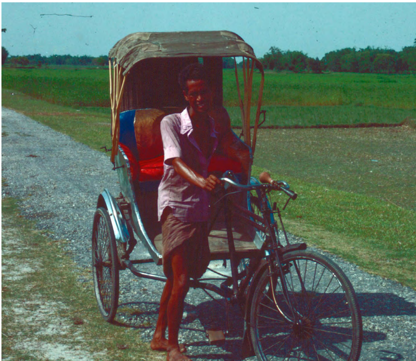
Rikshafärd från staden Haldibari till den indiska gränsstationen, från vilken man sedan måste promenera fyra kilometer till den bangladeshiska gränsstationen Chillahat.