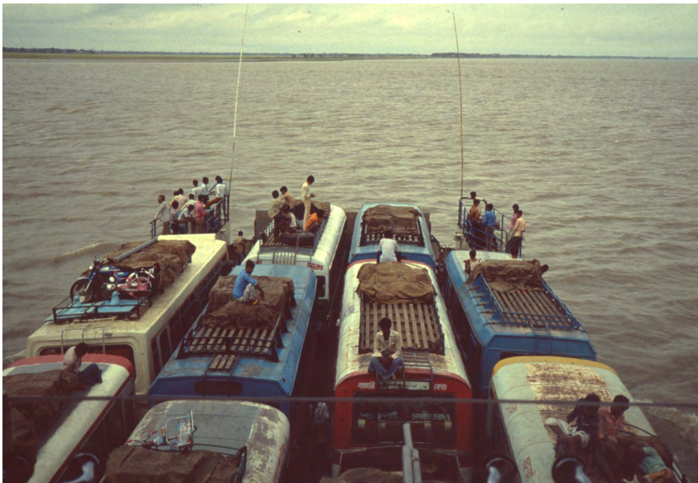
Färja över Brahmaputra