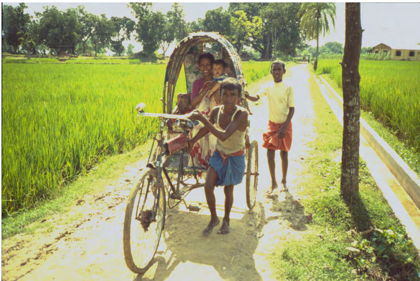
Riksha sista biten till byn