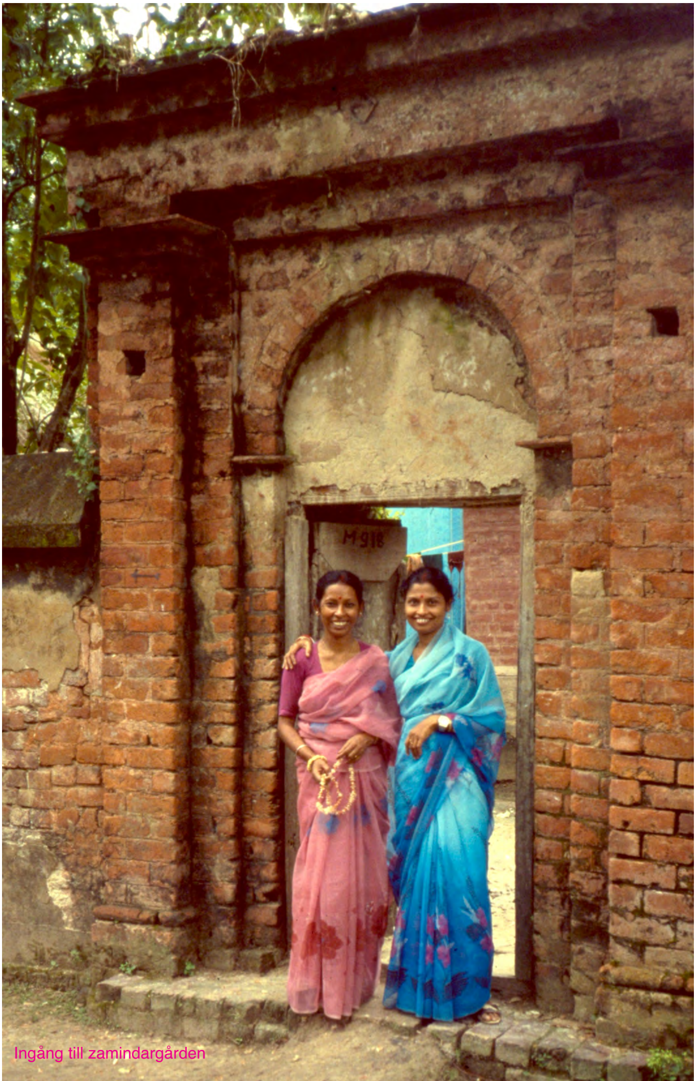
Ingång till zamindargården