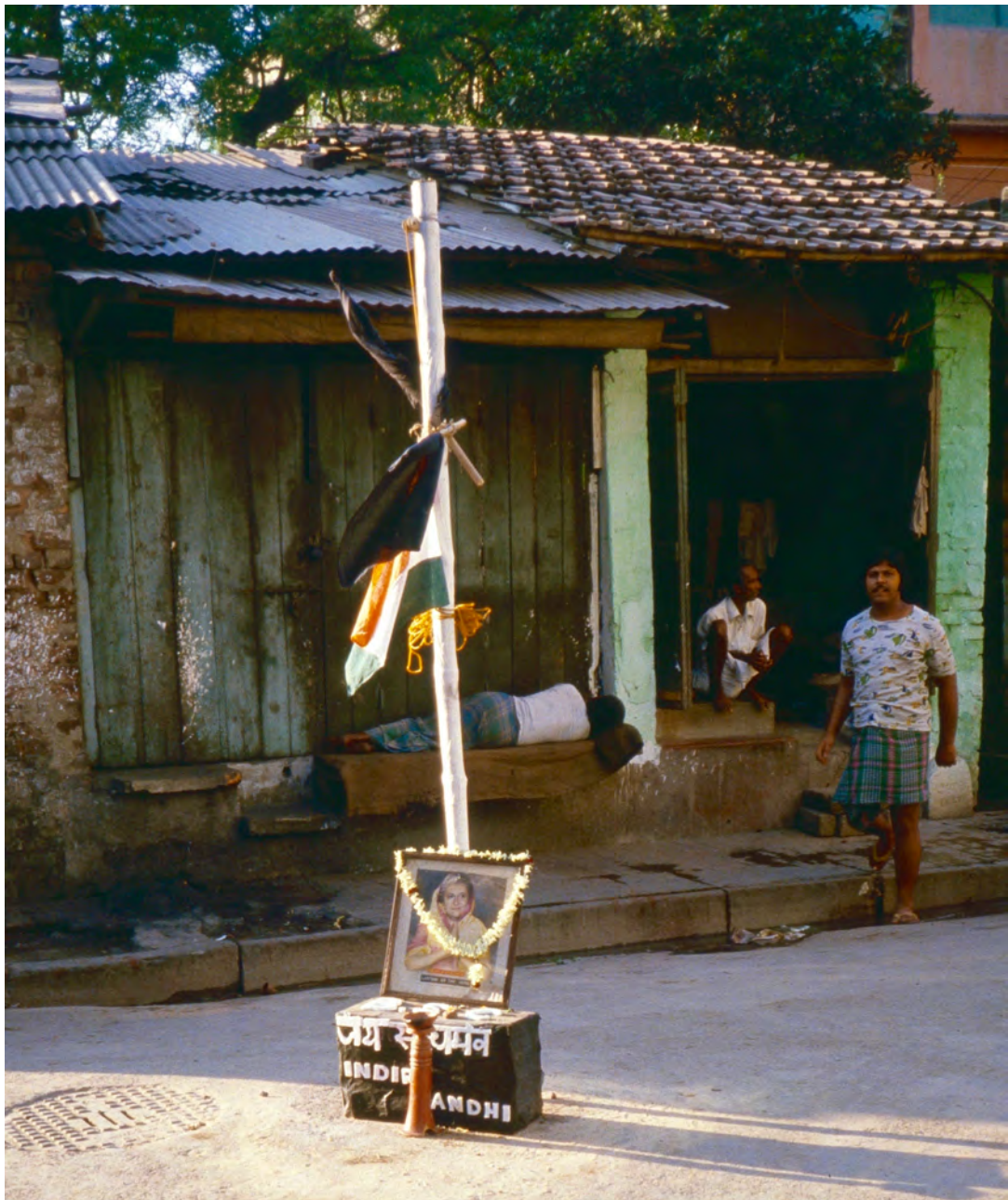
Indira Gandhi mördad den 31 oktober 1984