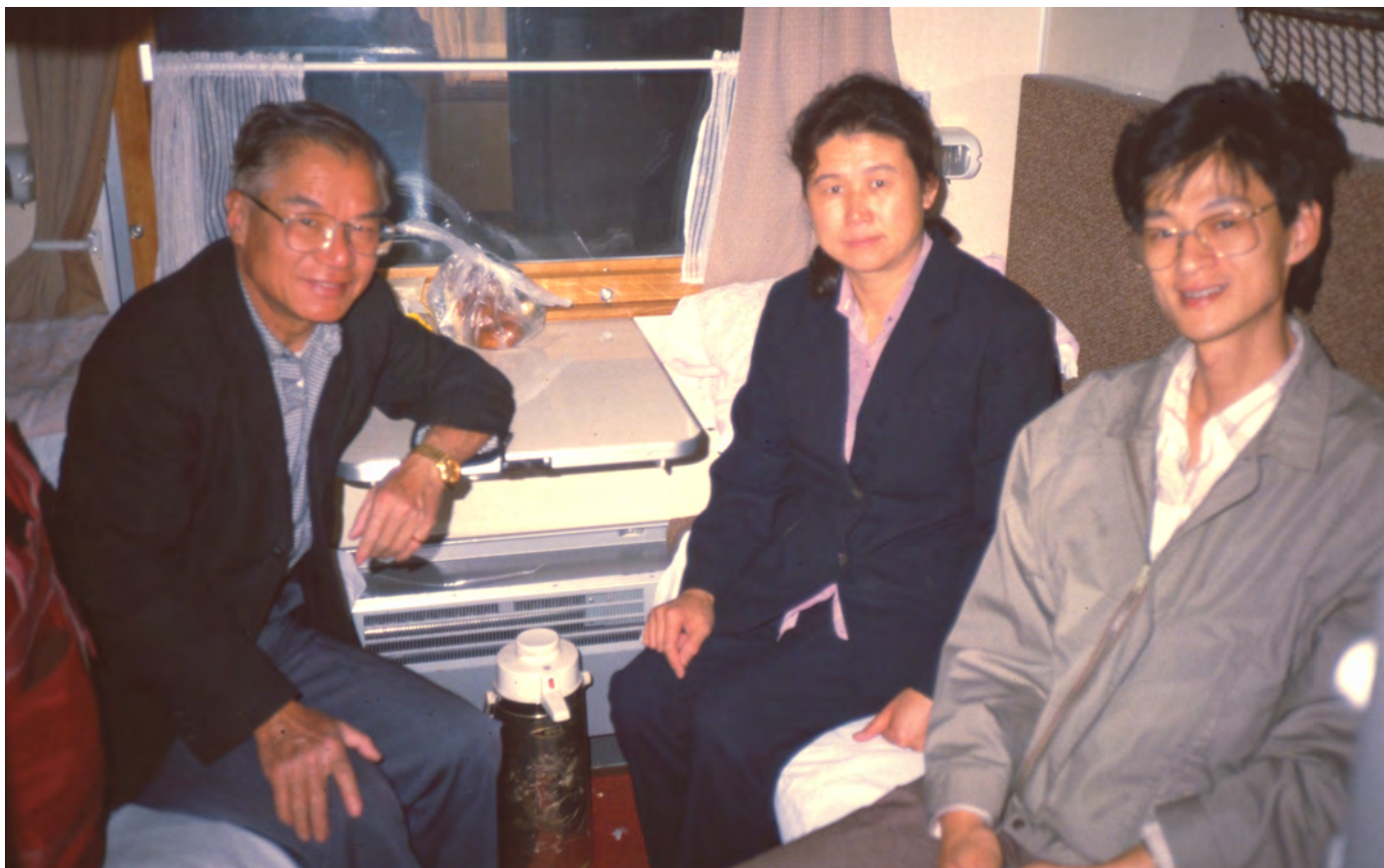
Tåg till Guangzhou