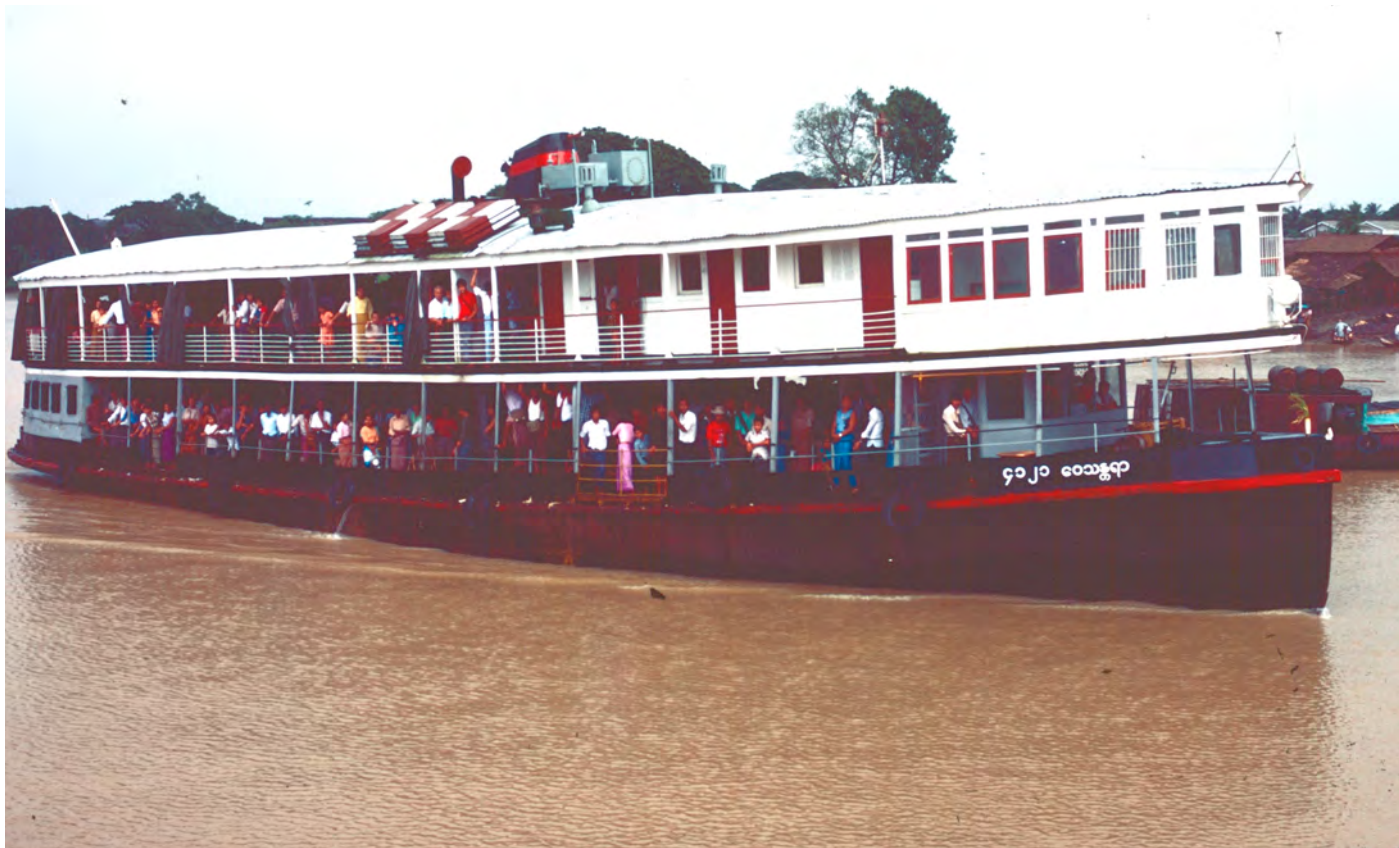
Färjan till Pegu