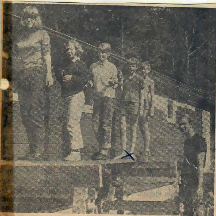
HÄSTVEDA SOMMARMARKNAD äger rum i morgon, torsdag, och av allt att döma torde tillslutning av såväl "ståndspersoner" som publik bli rekordartad, detta isynnerhet om vådrets makter också ställer sig positiva.

Hästvedagården. Psalm 475 sjöngs unisont varpå ungdomarna från Hästvedagården sjöng några sånger till eget ackompanjemang på git- tarr. Fader vår lästes gemensamt och som avslutning på den stäm- ningsfyllda andaktsstunden spelade musikkåren två musikstycken.