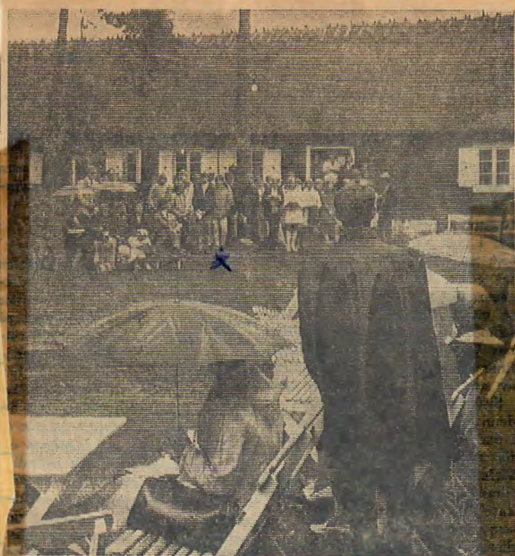
Trots att det regnade hade många sökt sig till friluftsgudstjänsten i Hembygdsparken i Hästveda.