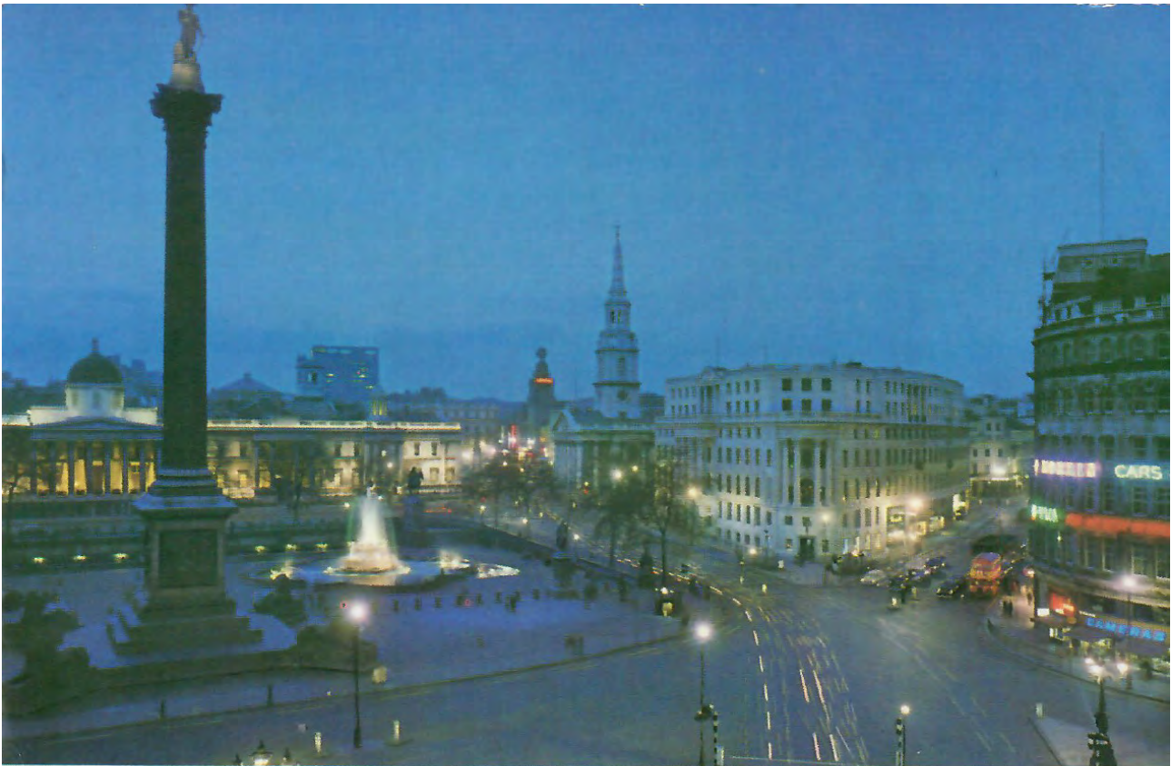
London—Trafalgar Square and The Strand, by night.