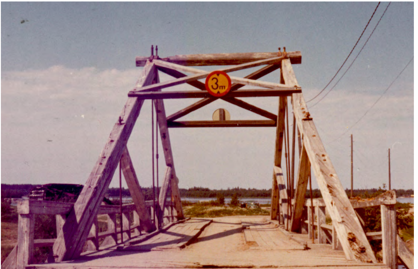
Finland; Oulu (Uleåborg) och Kuopio