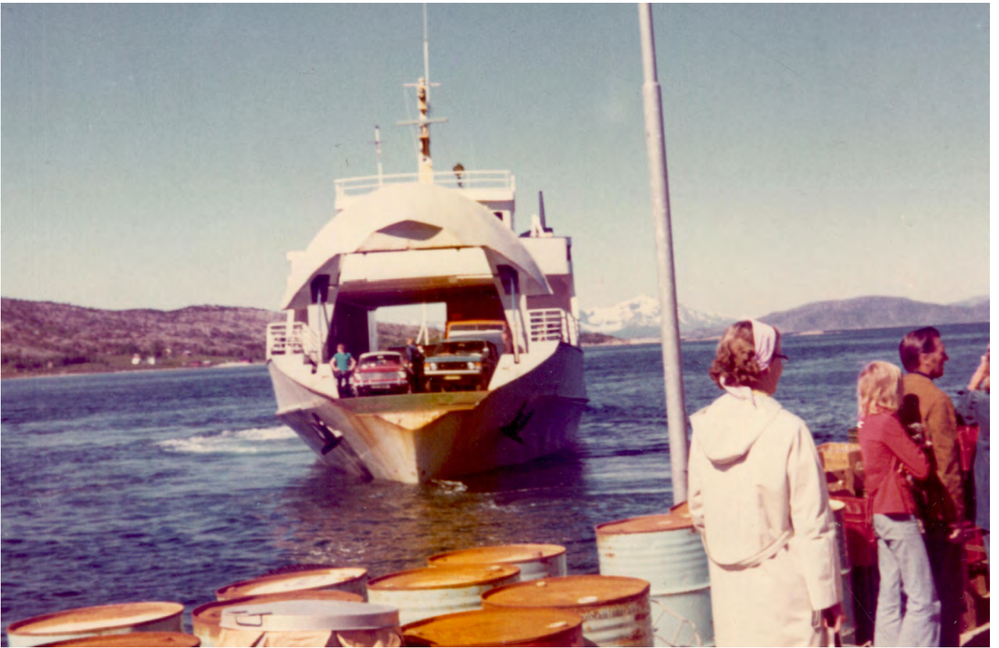
Färjeöverfart på vägen mot Narvik