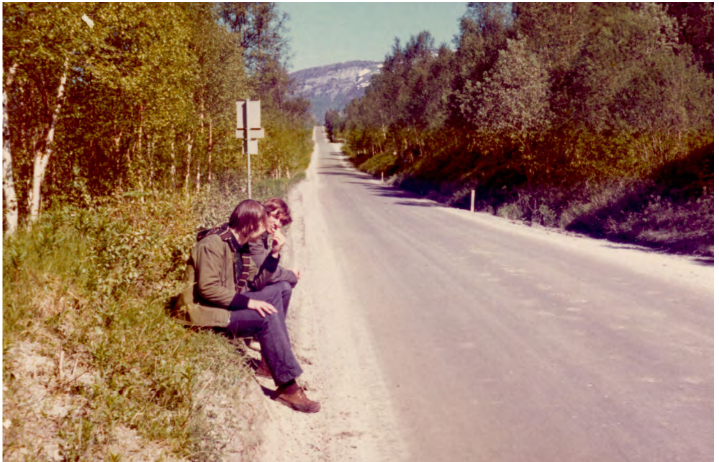
Liftande vänner på vägen