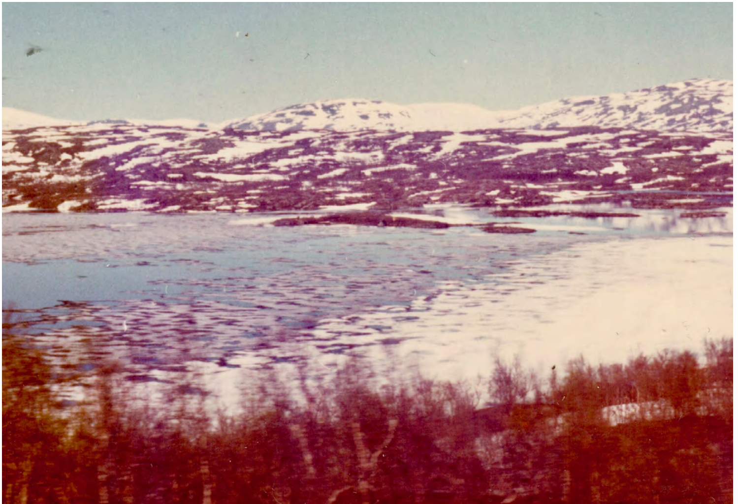
Torne Träsk, färden från Narvik till Kiruna