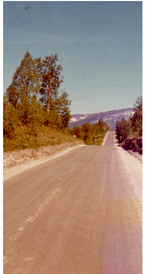
E6 genom Nordnorge