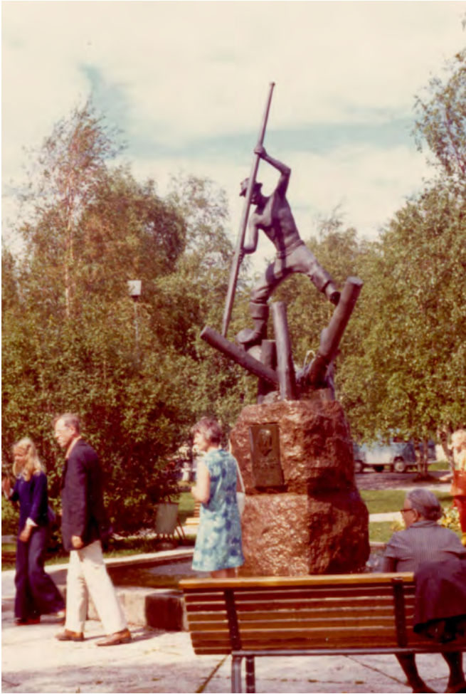
Stadsparken i Jokkmokk