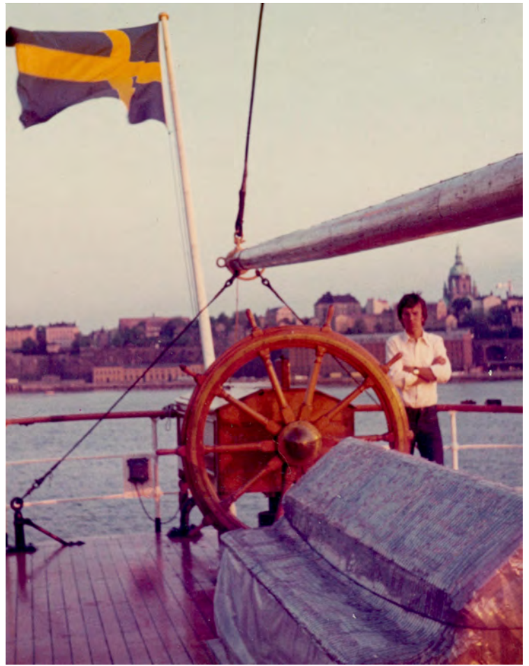
Bodde på vandrarhemmet af Chapman i Stock-