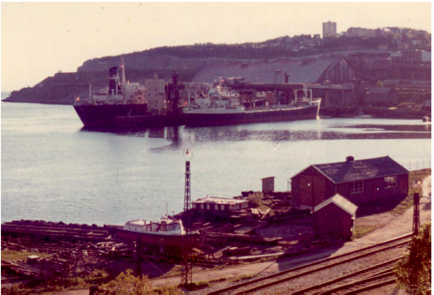
Midnattssol över Narvik