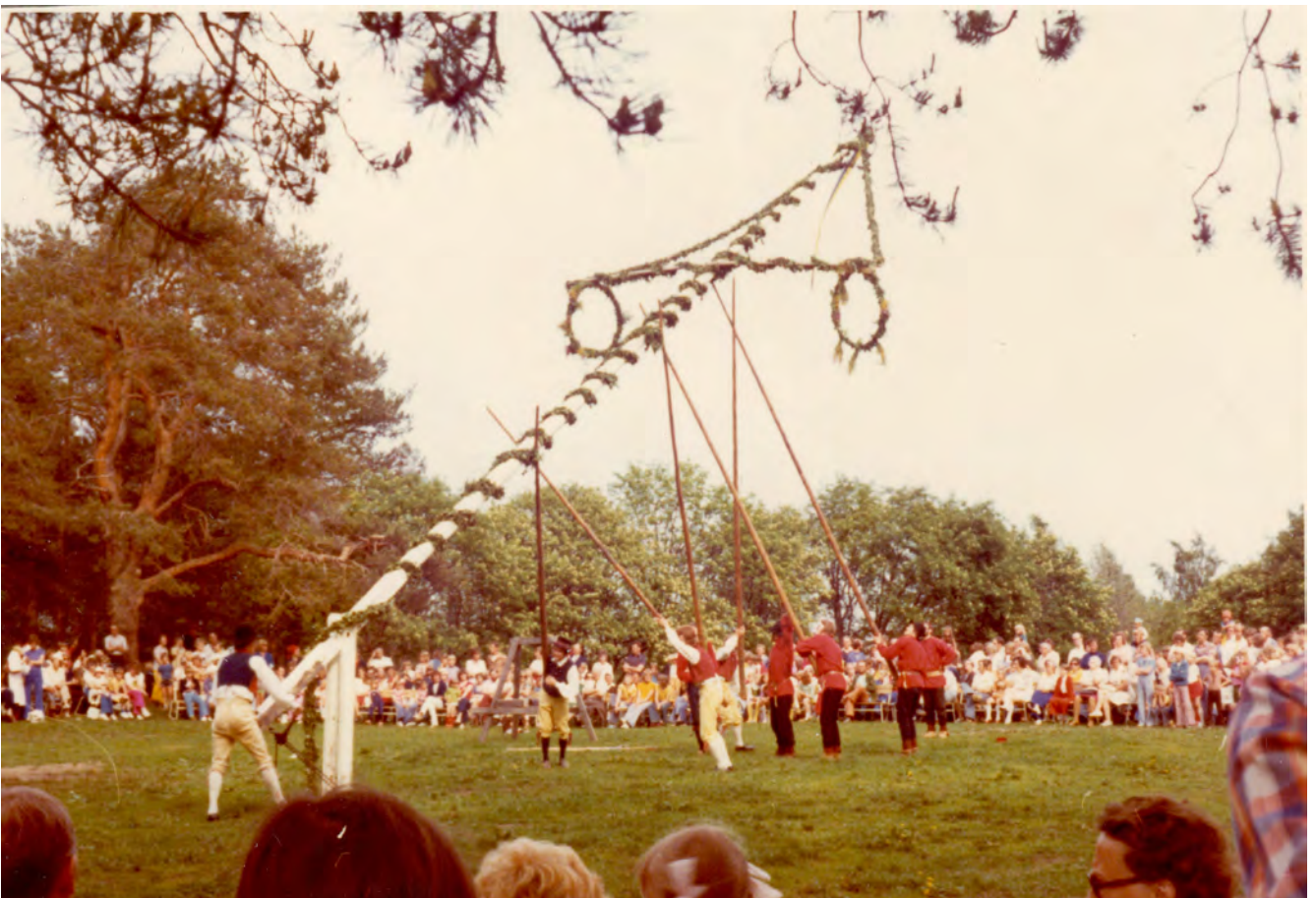
Midsommarfirande på Gältzau-udden i Luleå