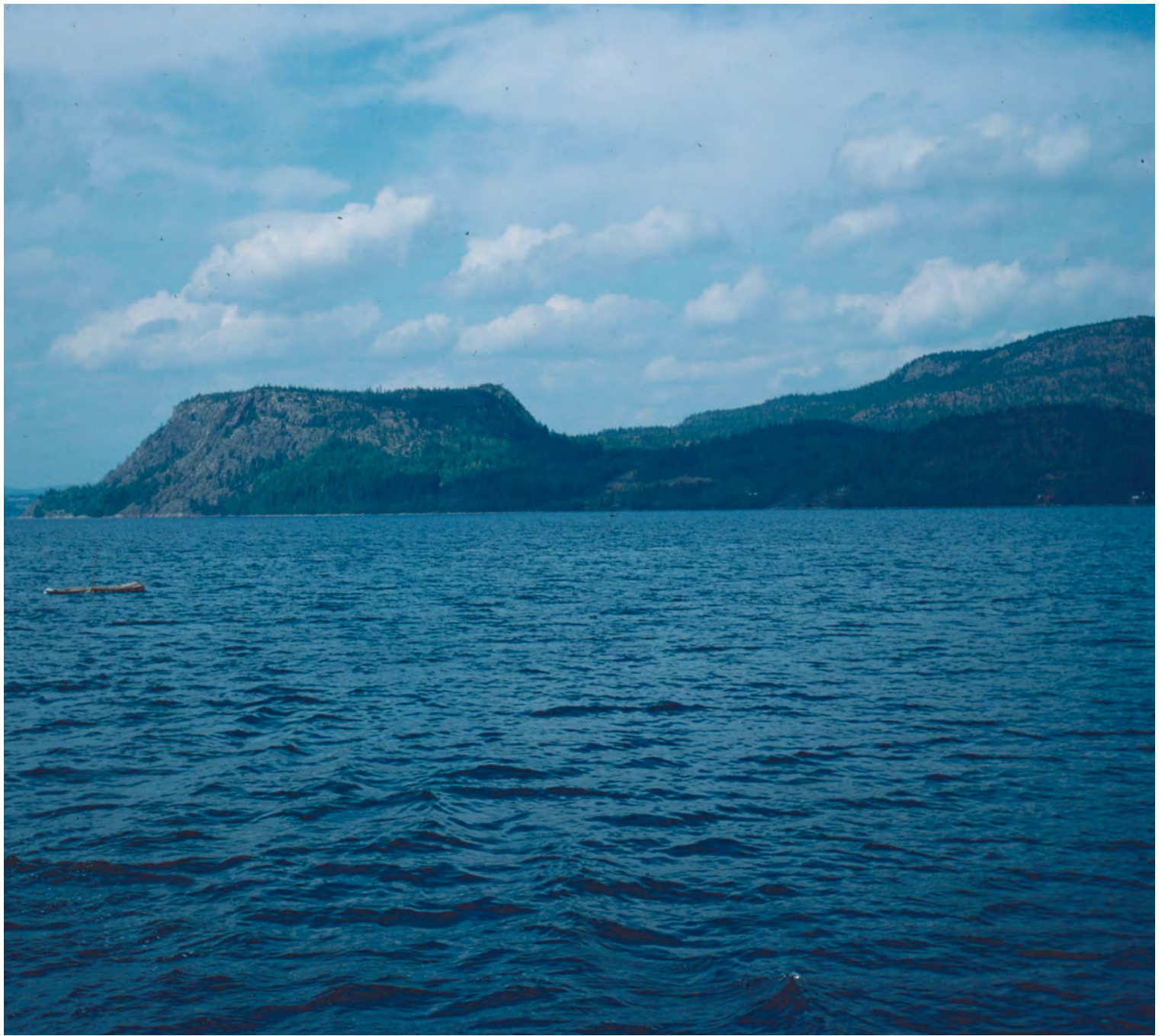
BÅTFÄRD TILL ULVÖN