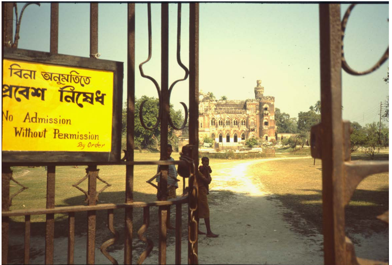
Besök till zamindarpalats i Dhanyakurya nära Barasat