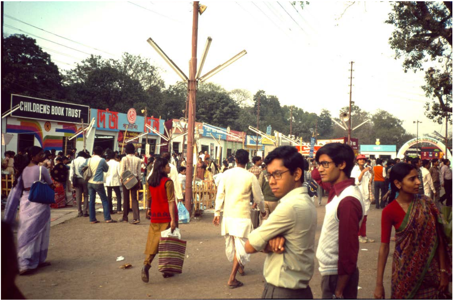
Calcutta Book Fair på Maidan