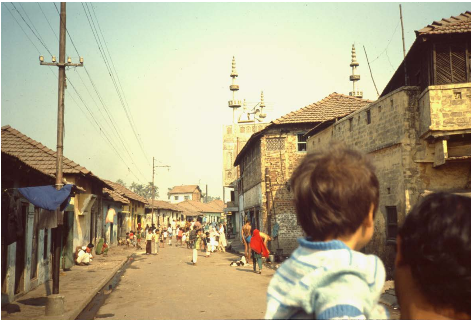
Vandring i Belgachia