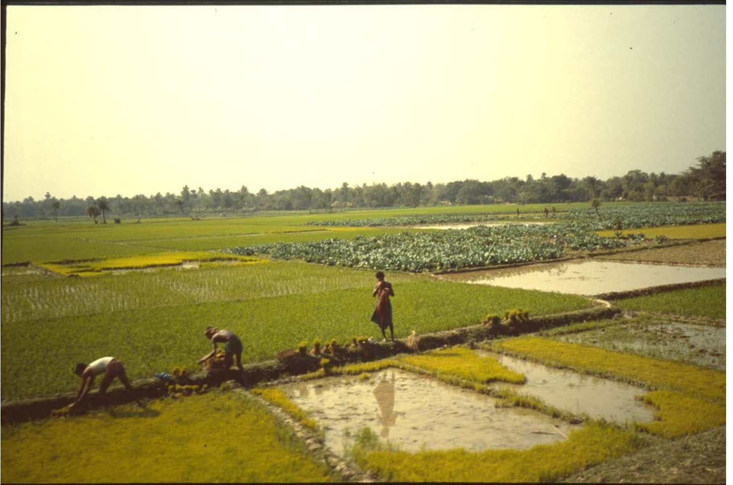
Livet på landet i Bhangar nära bangladeshiska gränsen