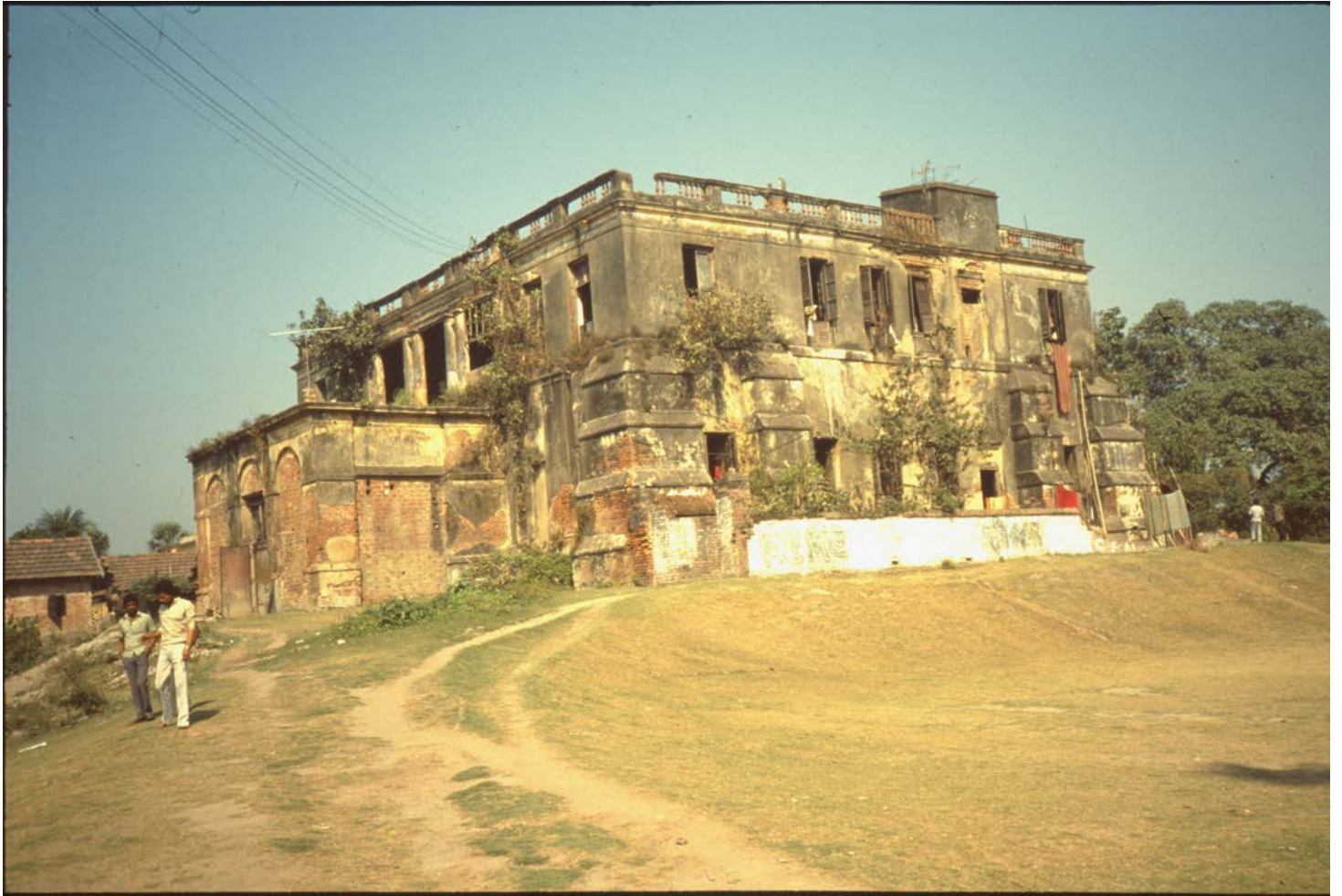
Warren Hastings villa i DumDum