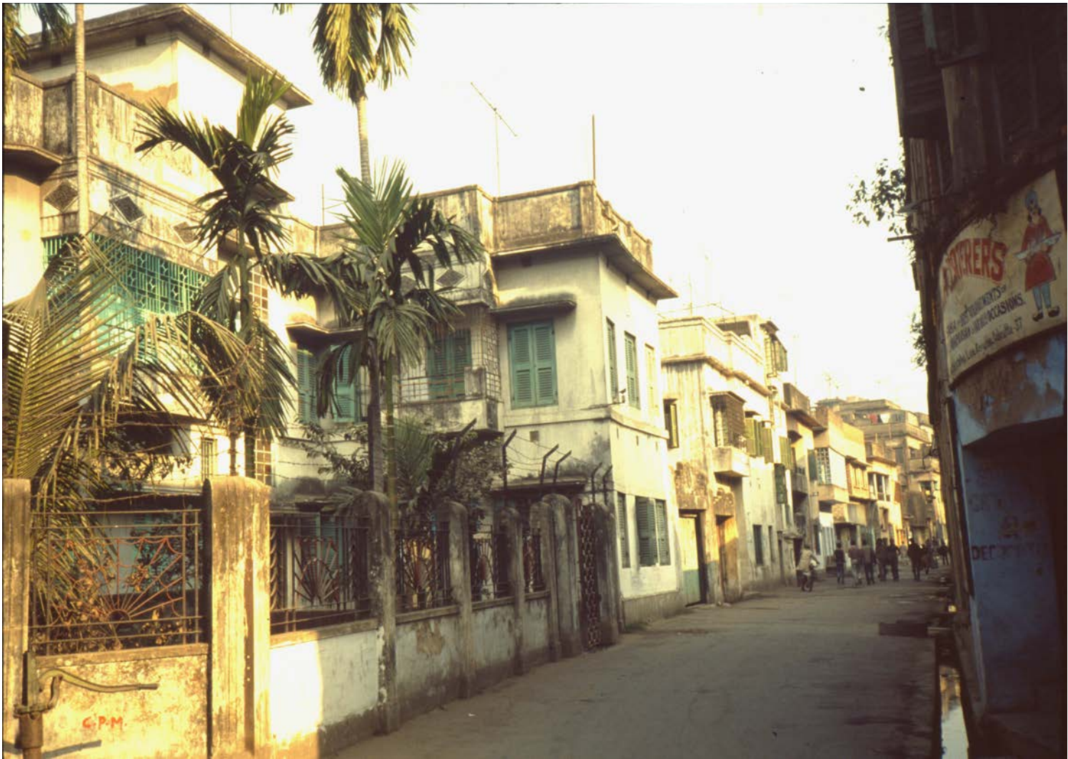
Hemma i Paikpara med Kumkum