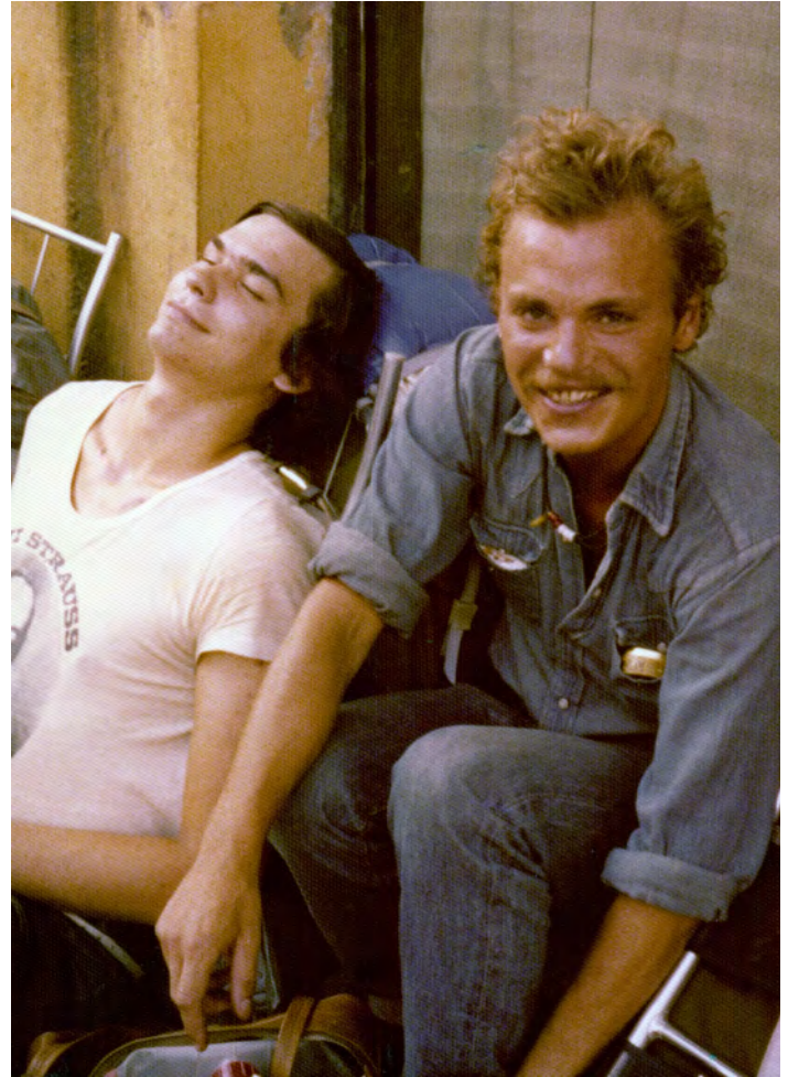
Hemresa med flyg från Wien