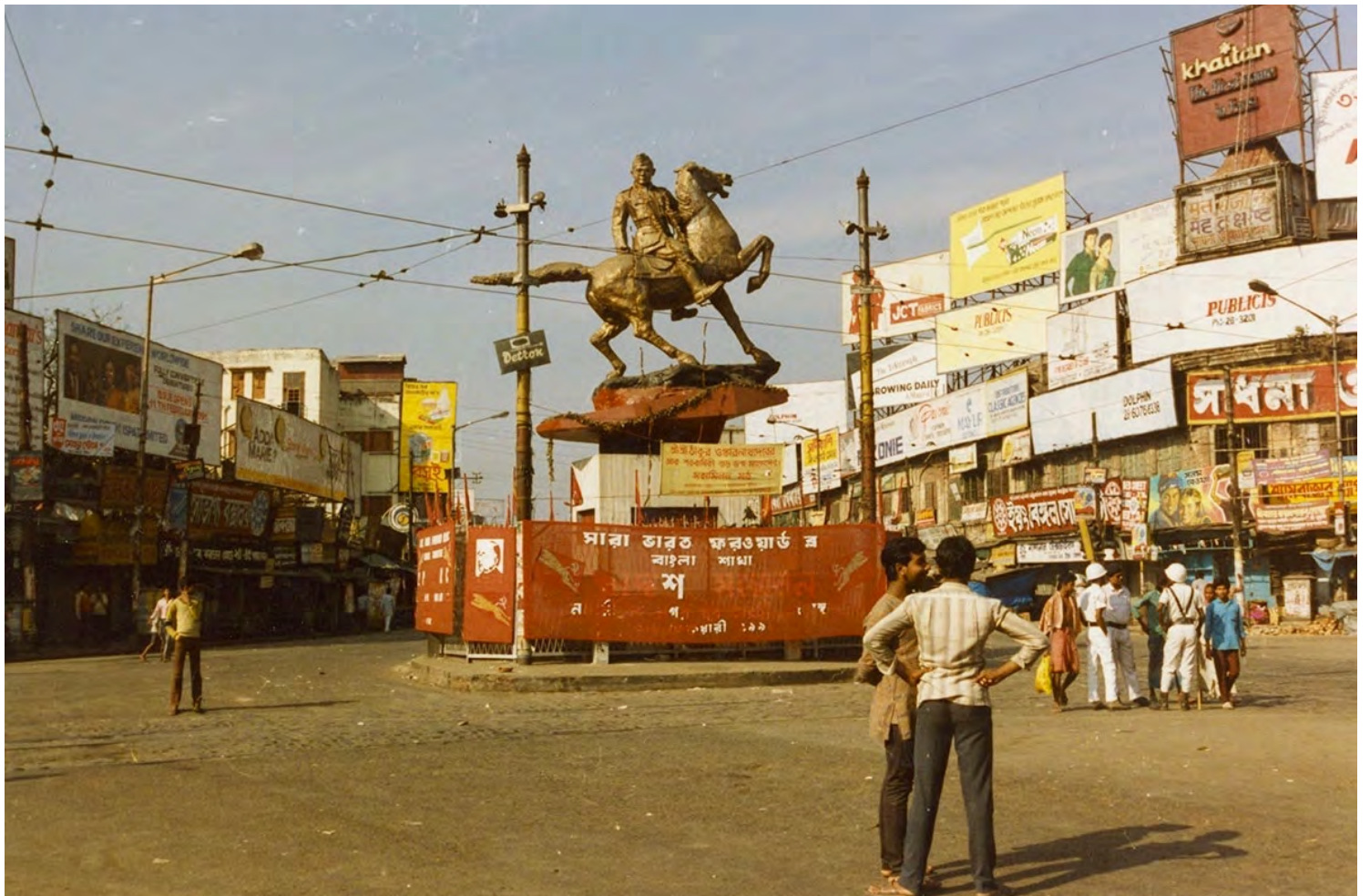
Netajistatyn på Shyambazar