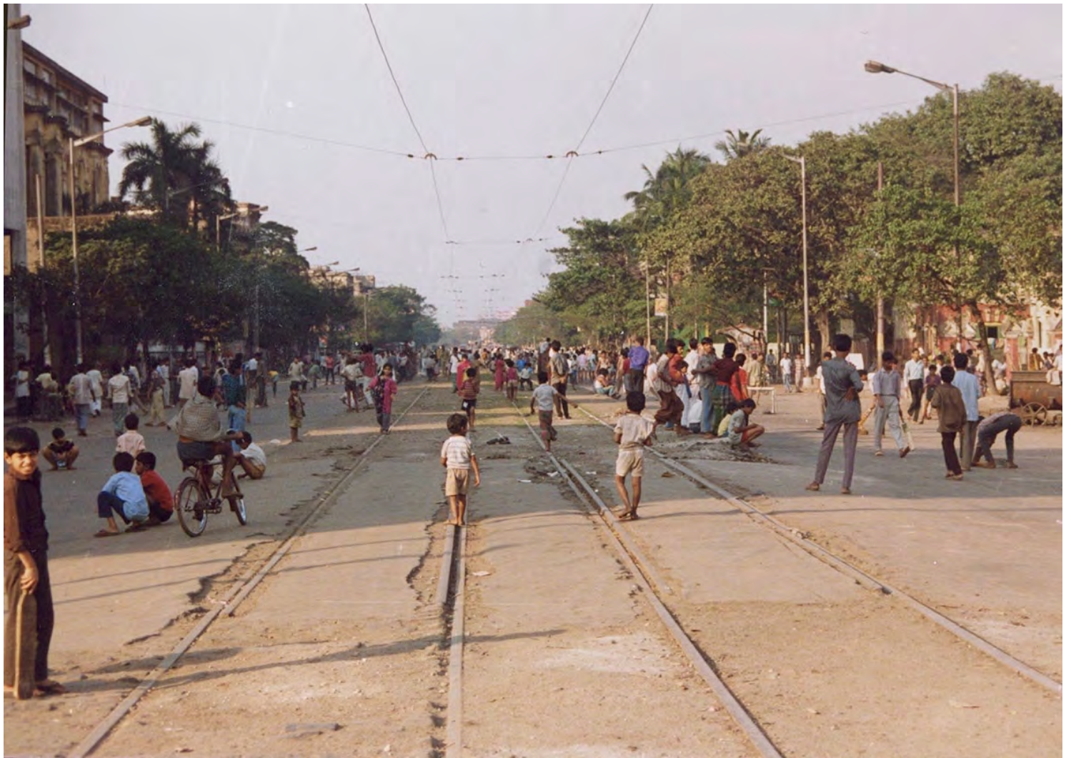
Bangla Bandh 5 januari 2001