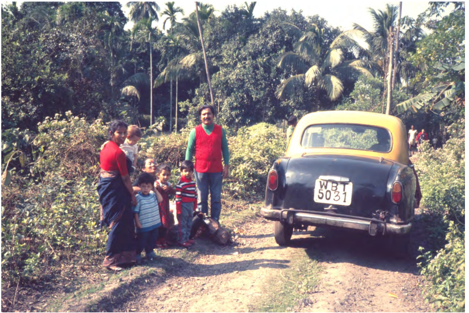
Picknick i jultid