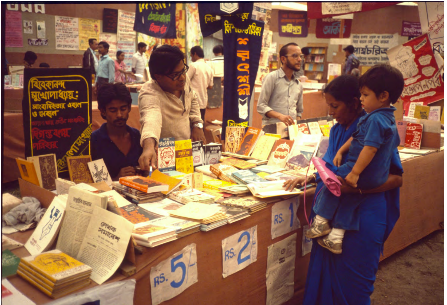
Calcutta Book Fair 1987