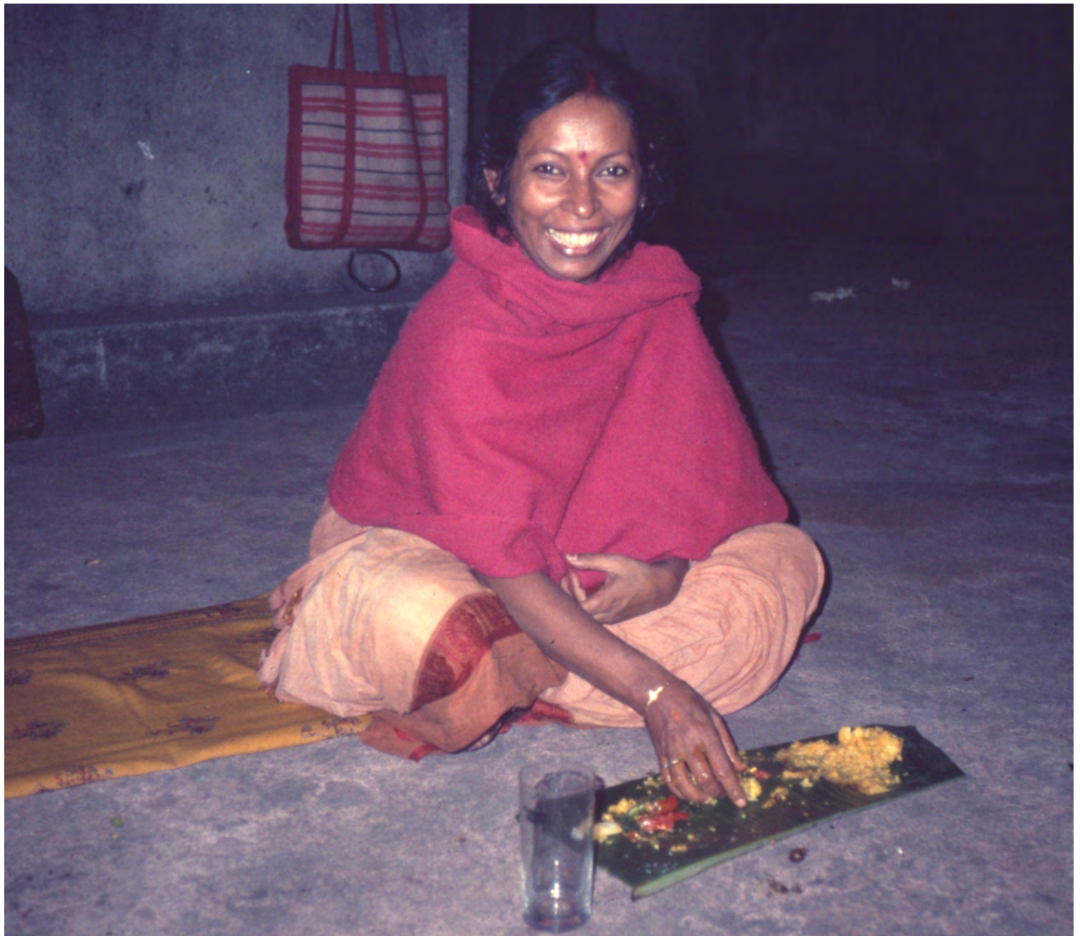
Middag på taket