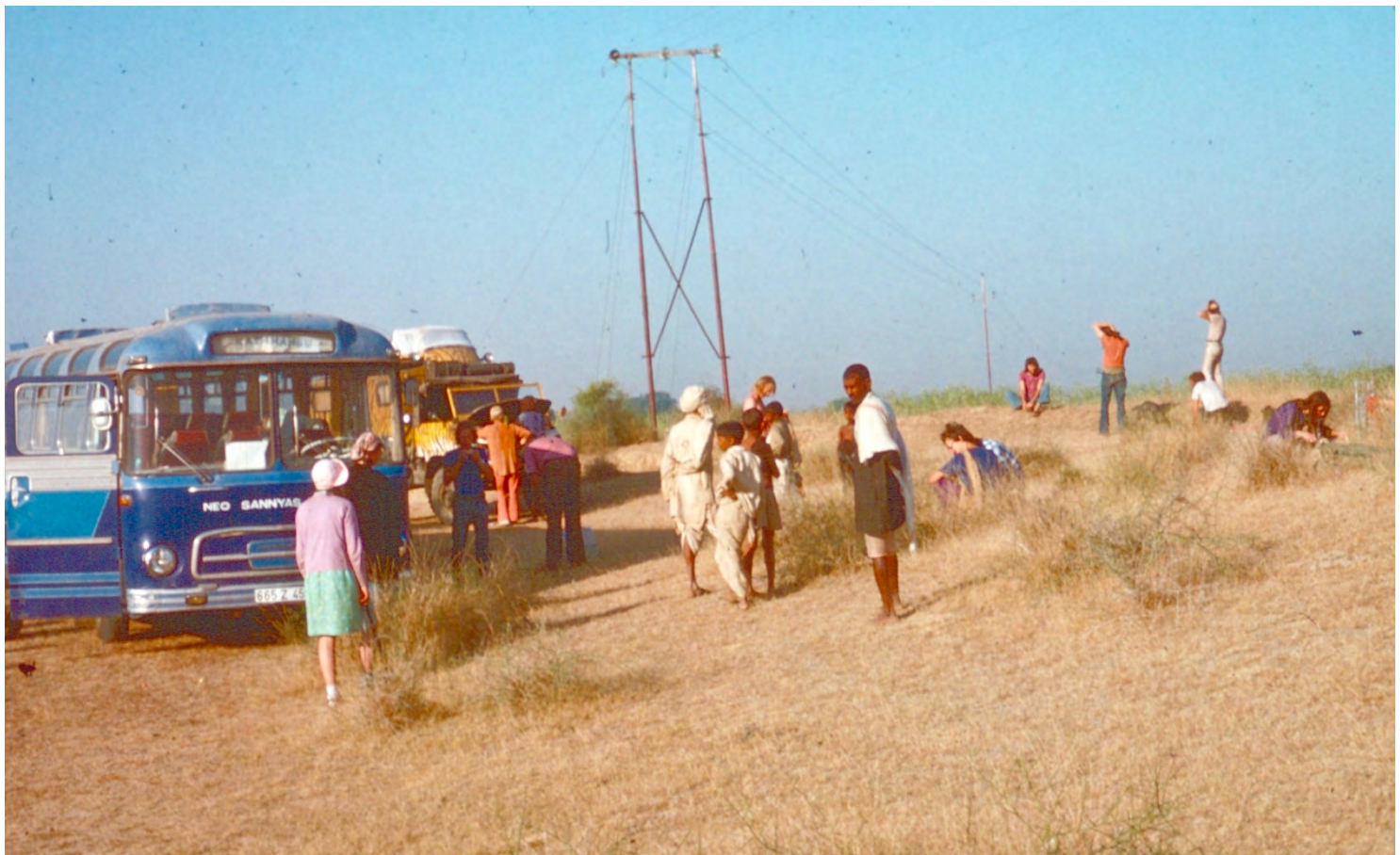
Övernattning för bussresenärerna nära Kanpur