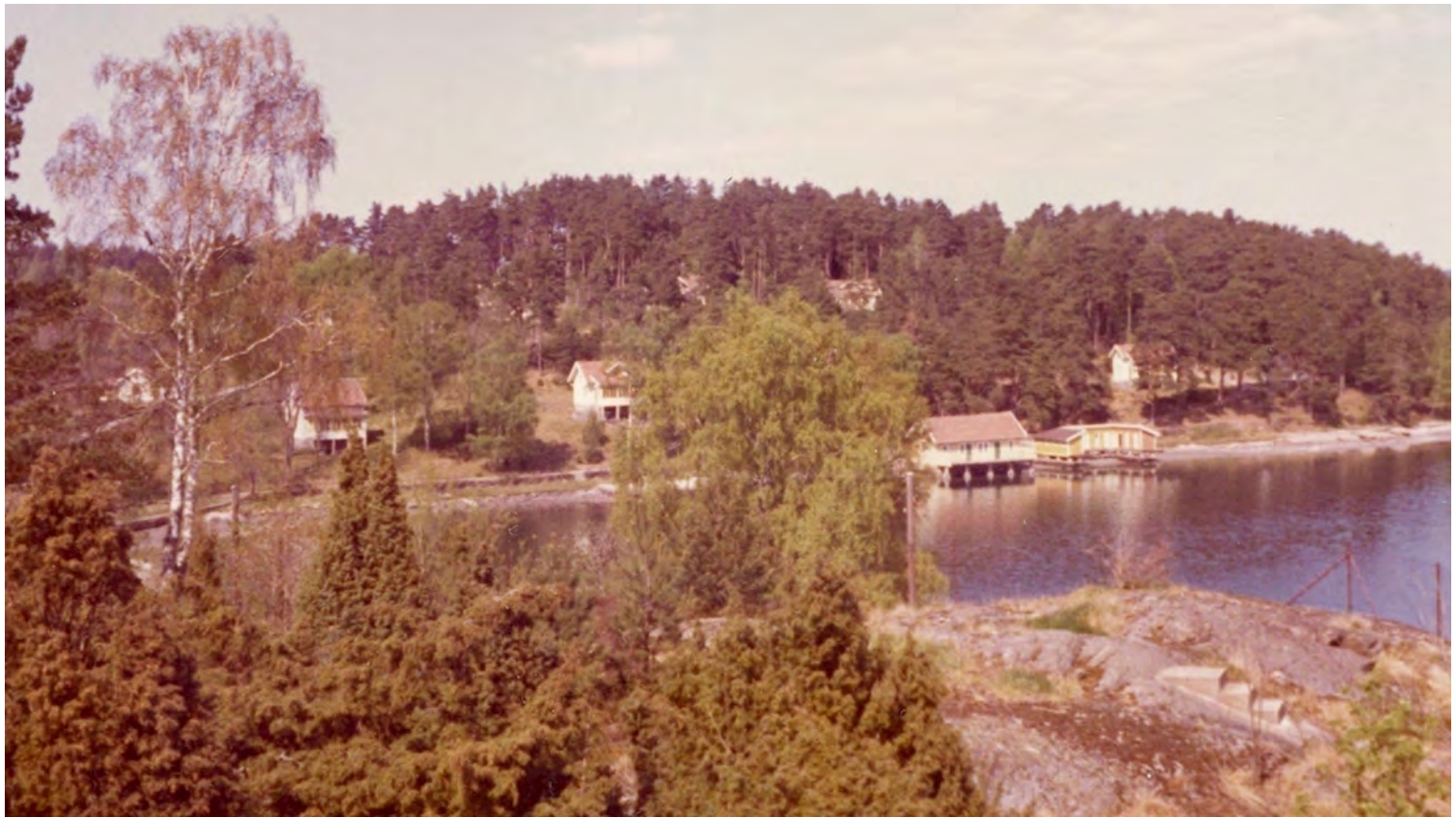
Stilingsöns badsamhälle på Orust