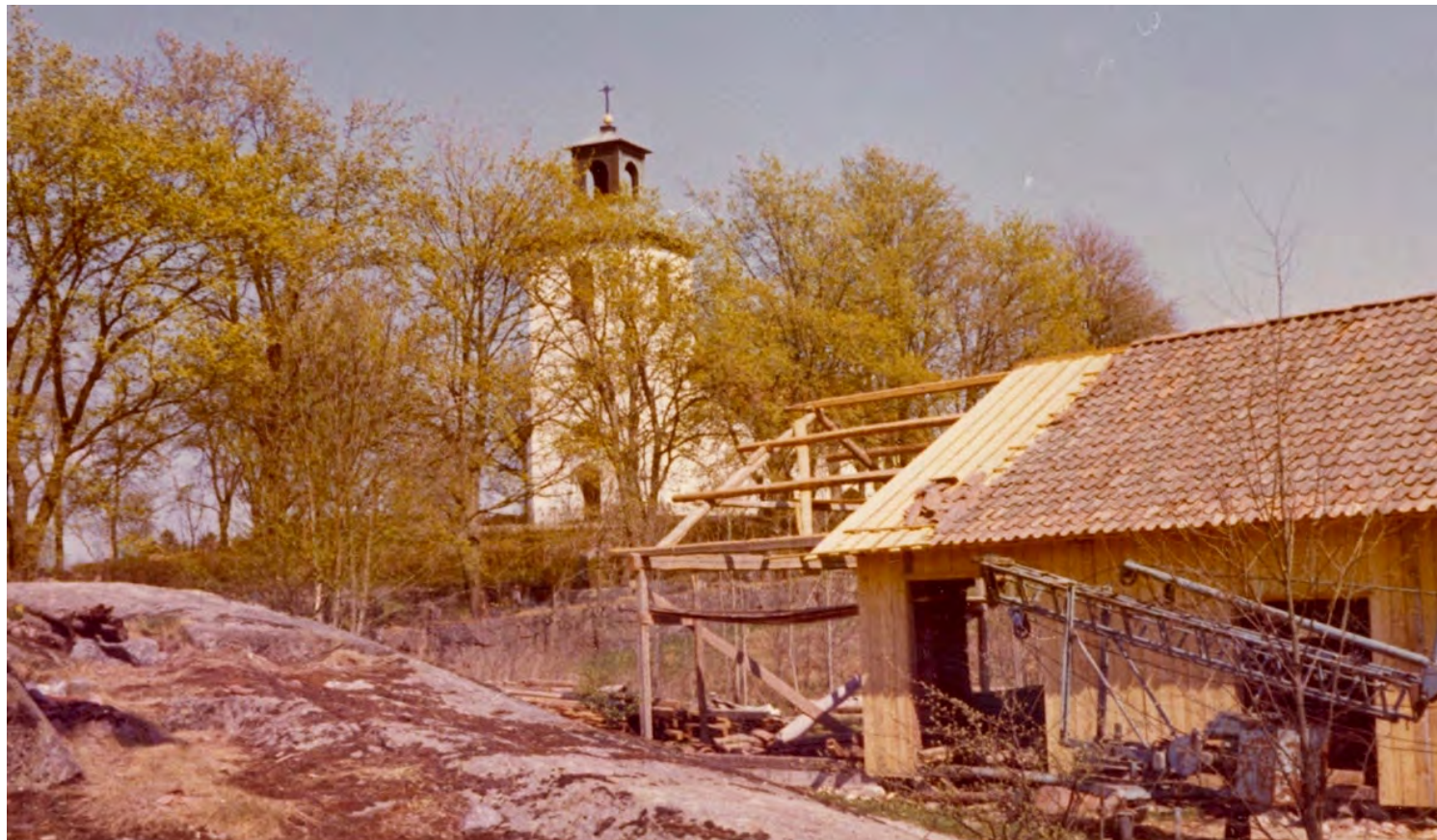
Myckleby kyrka på Orust