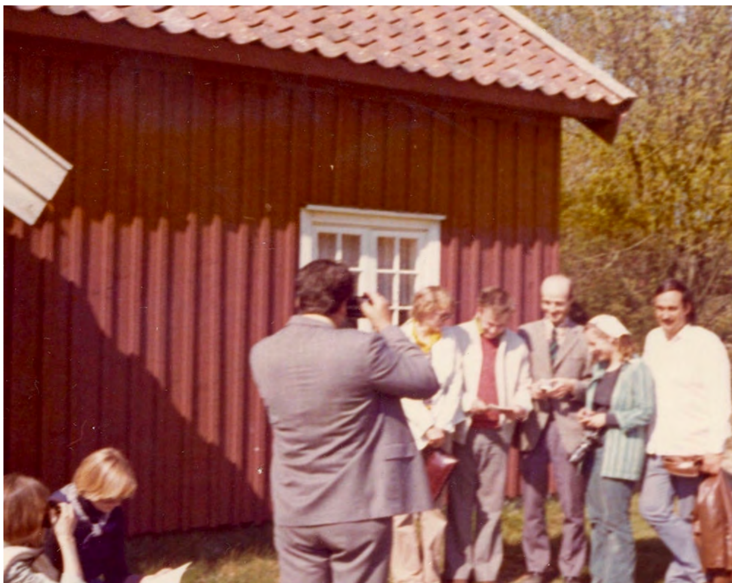
Reporter för lokaltidningen intervjuar gruppen