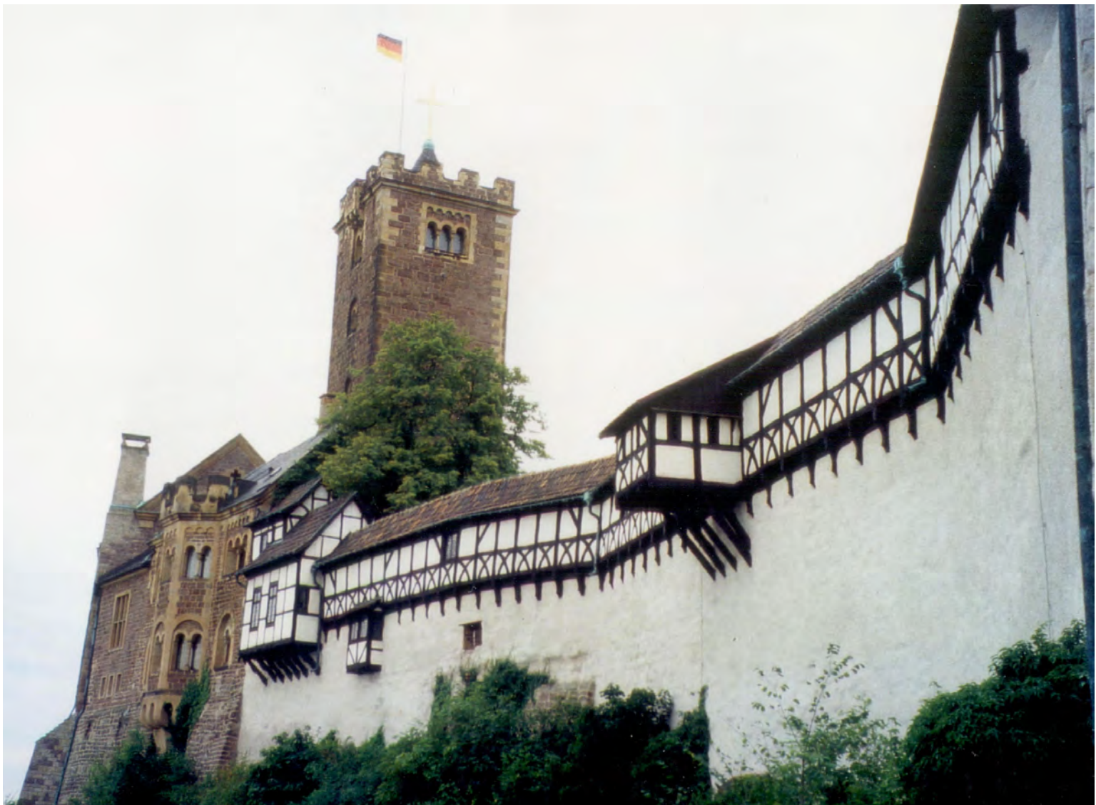
Wartburg i Eisenach