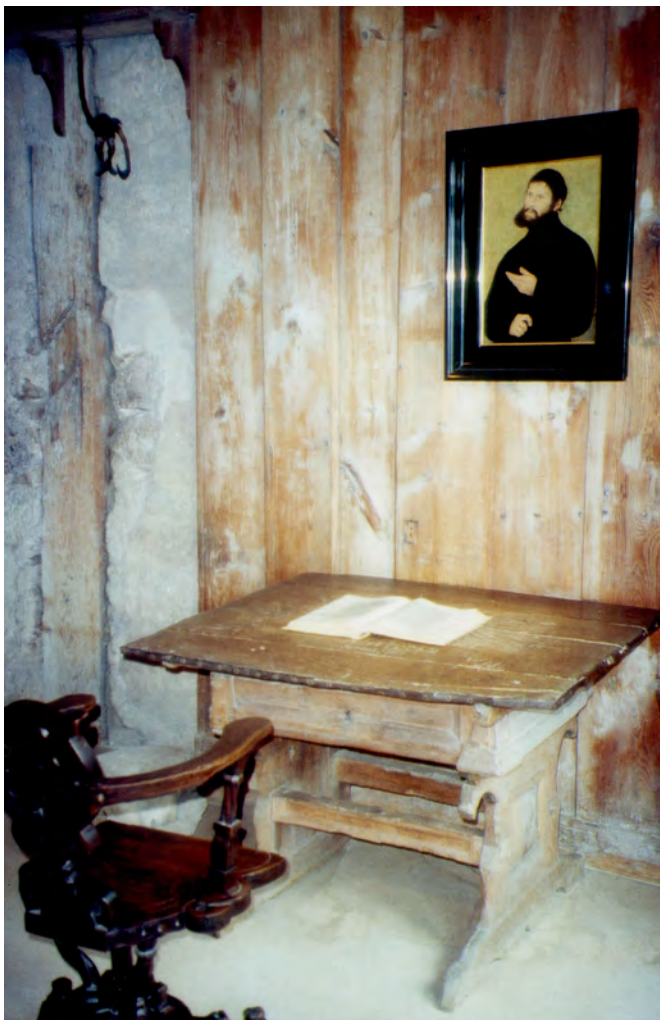
Här översatte Luther Bibeln till tyska