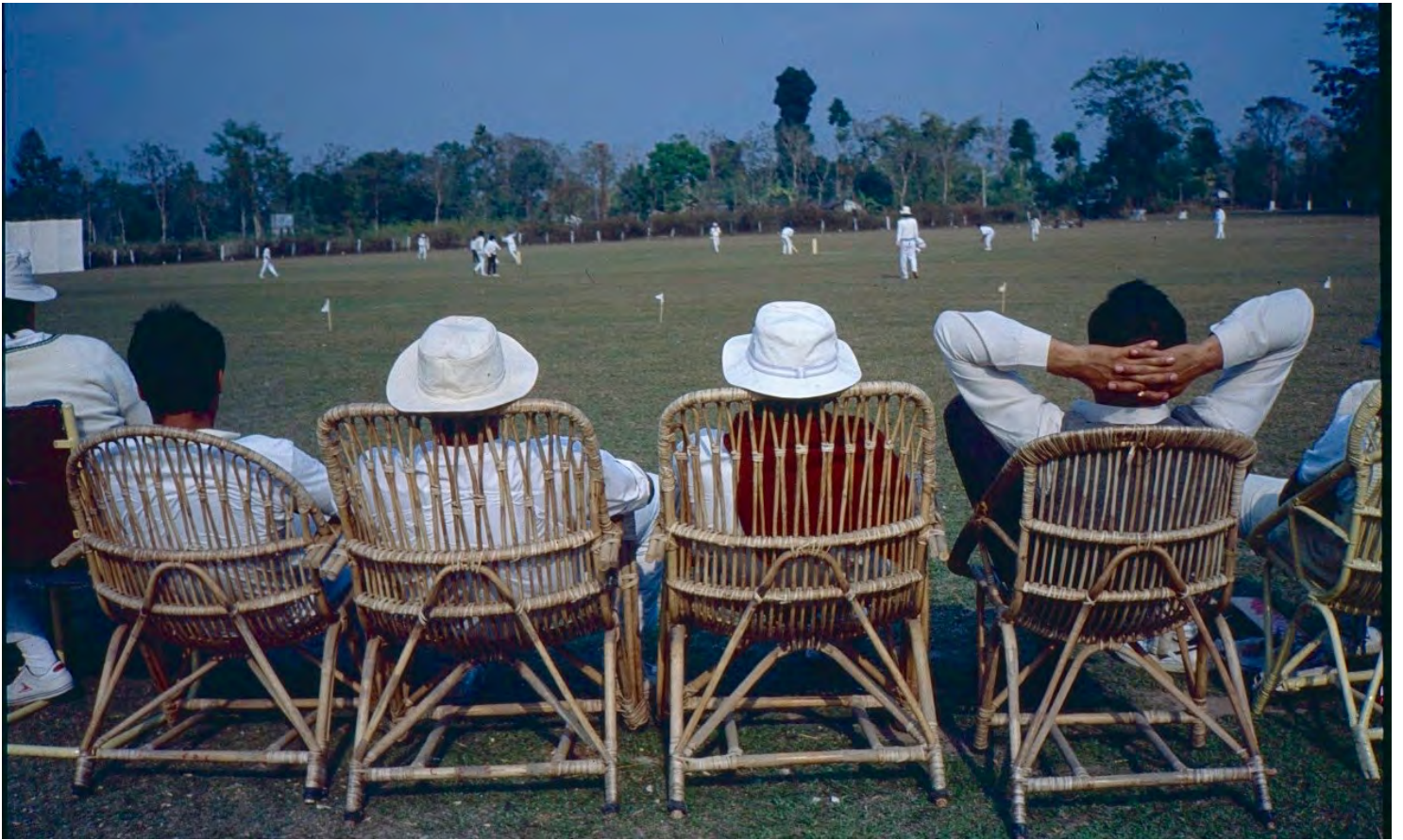
CHALSA TEA ESTATE/INTER-COMPANY CRICKET TOURNAMENT 1991