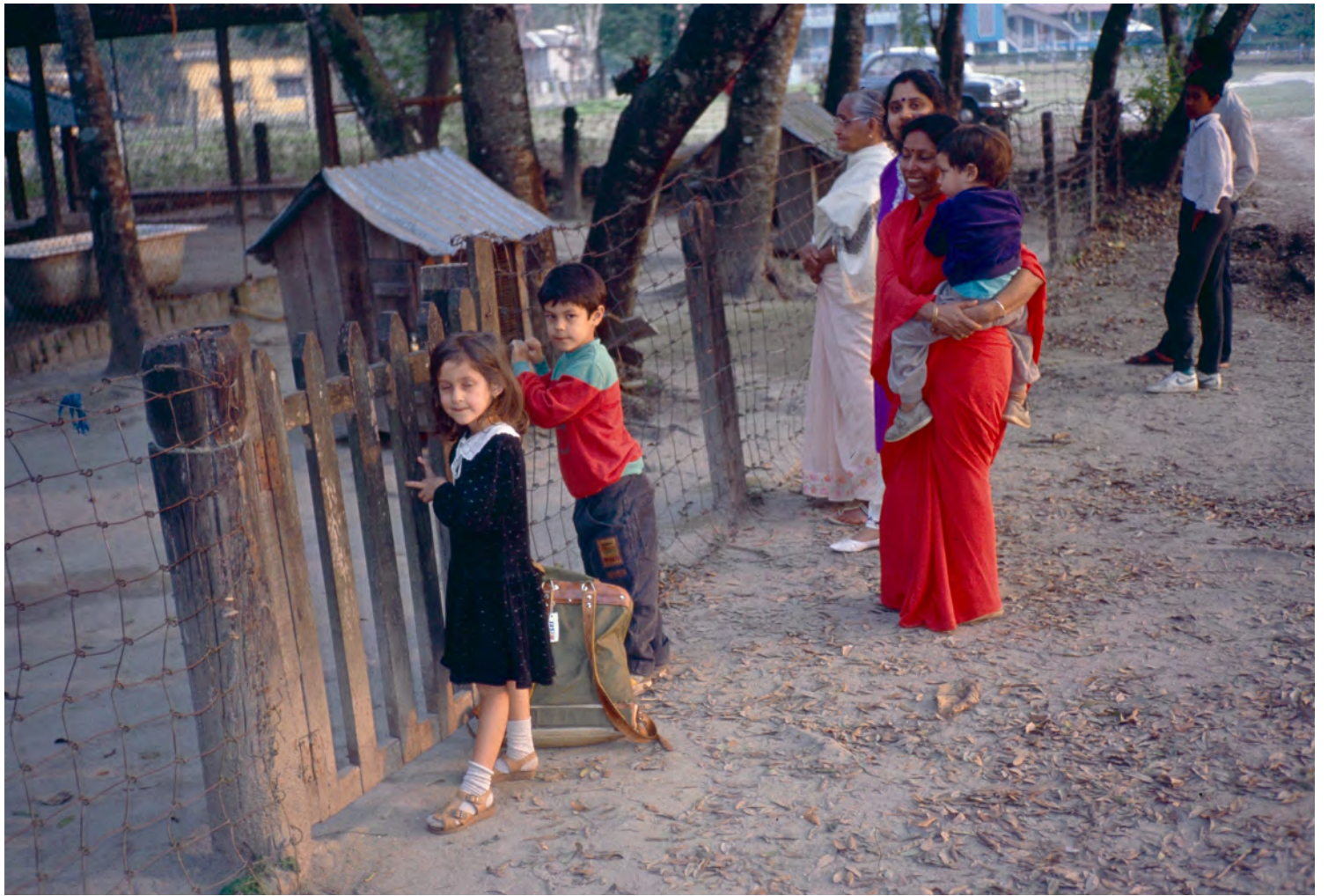
JALDAPARA WILDLIFE SANCTUARY