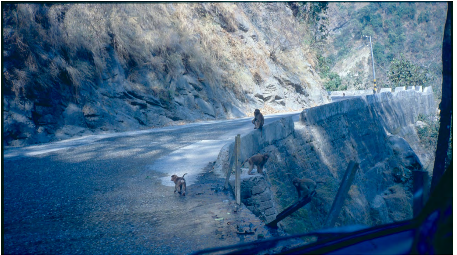
PÅ VÄG MOT DOOARS