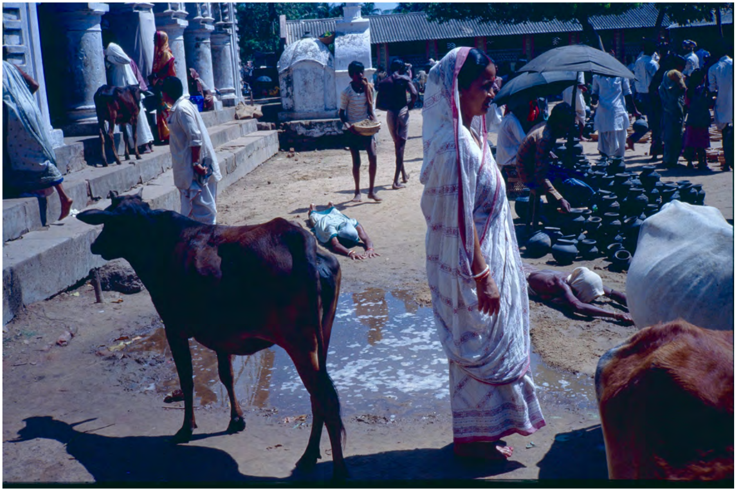
SHIVA-TEMPLET | CHANDANESWAR, ORISSA