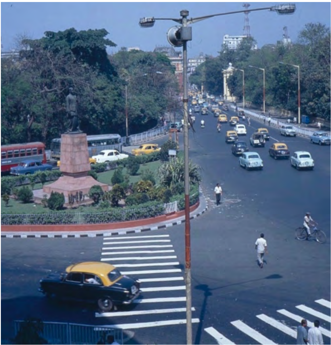
KOLKATA CITY CENTRE